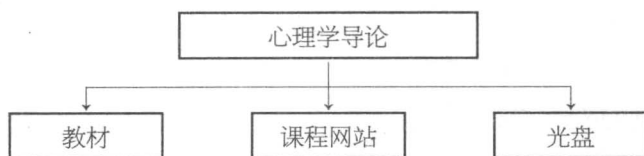
图1 立体化课程结构图