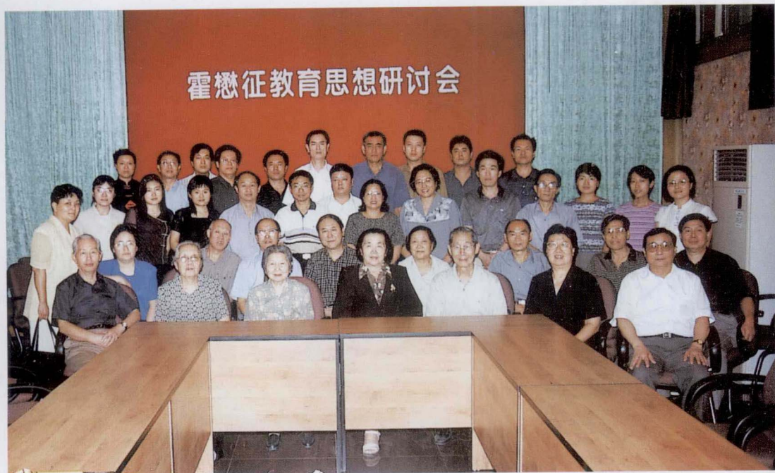
2001年9月15日，霍懋征教育思想研讨会在北京第二实验小学召开。