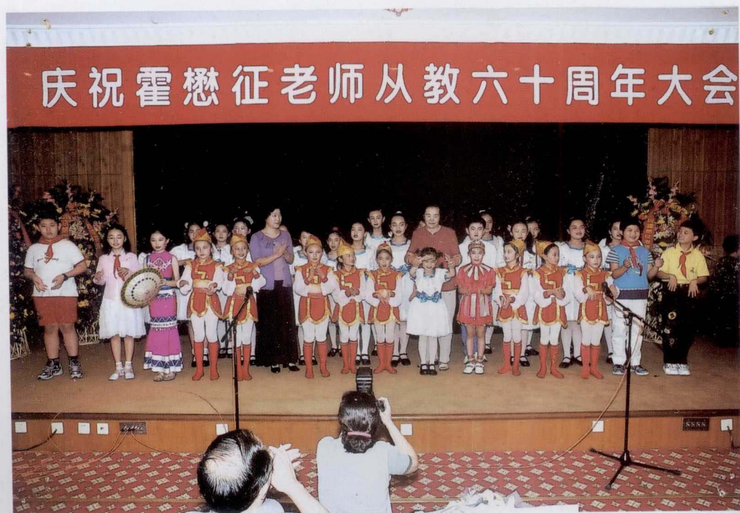
庆祝霍懋征老师从教六十周年大会在北京举行。