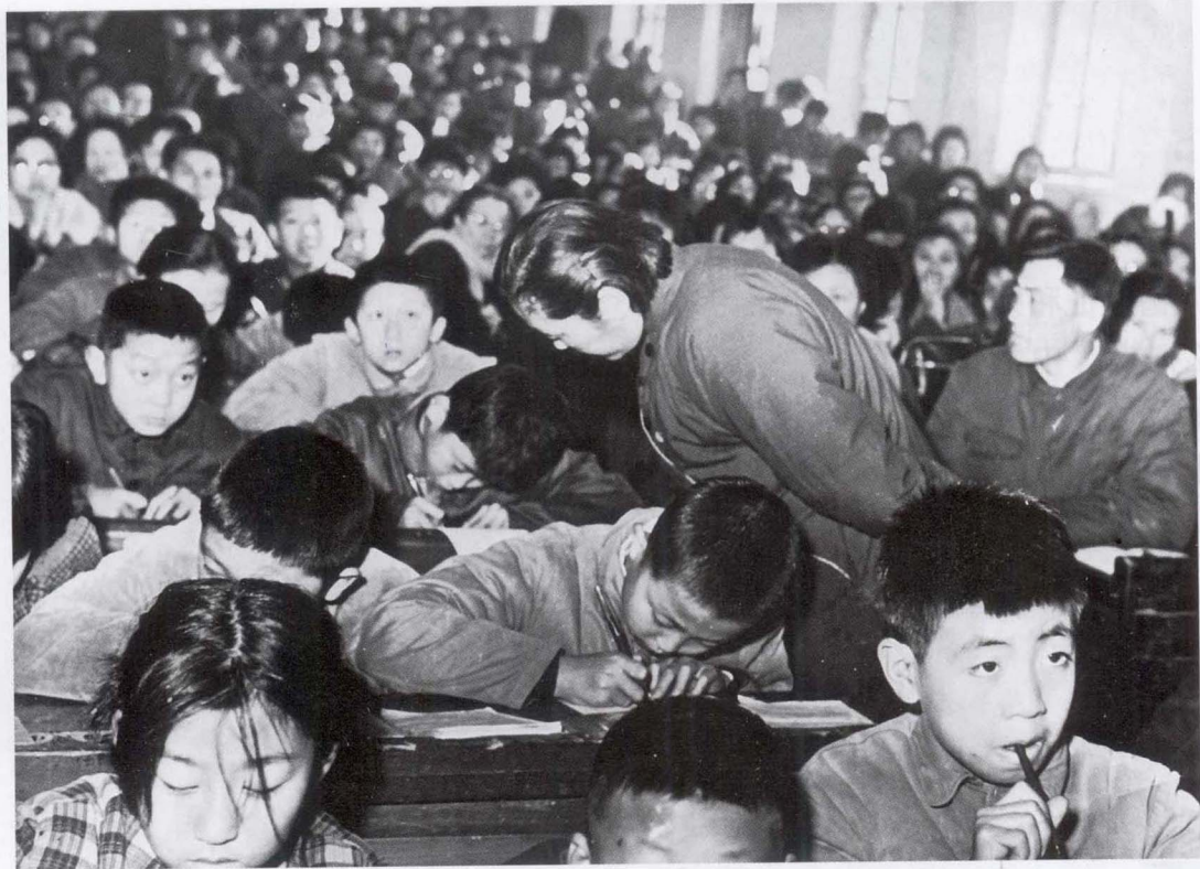
1979年11月，霍懋征在东北师大附小指导作文。