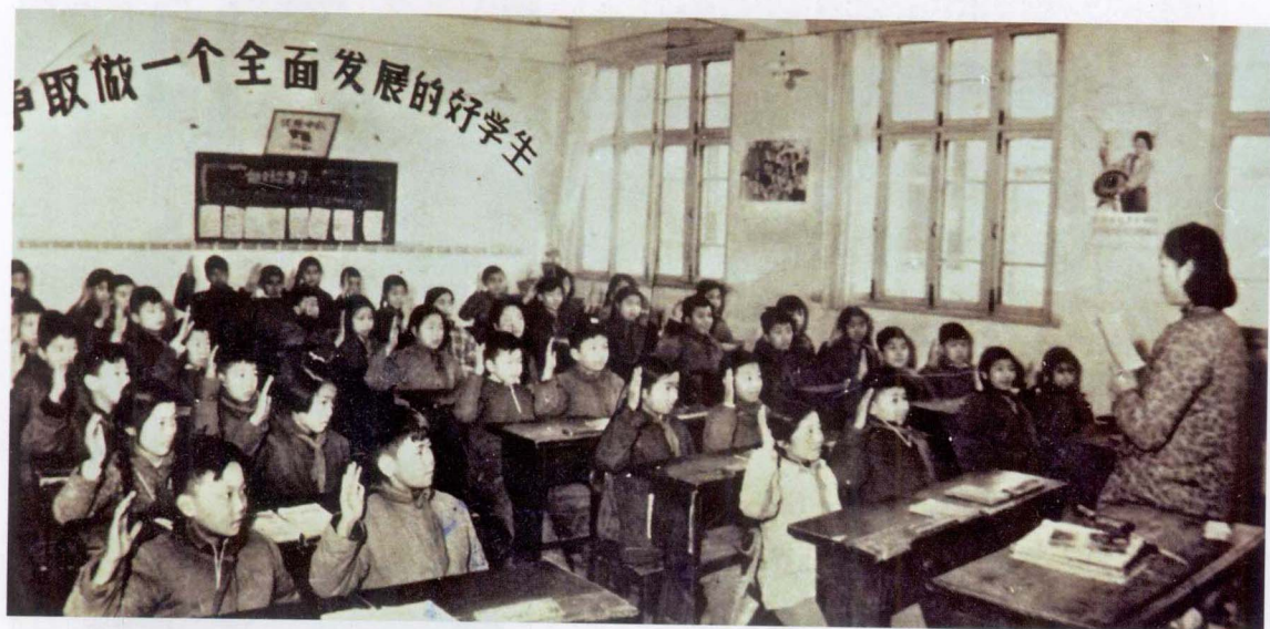
1959年10月，霍懋征在北京第二实验小学讲课。