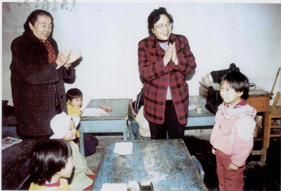
2002年4月， 霍懋征在甘肃天水农村小学讲课。