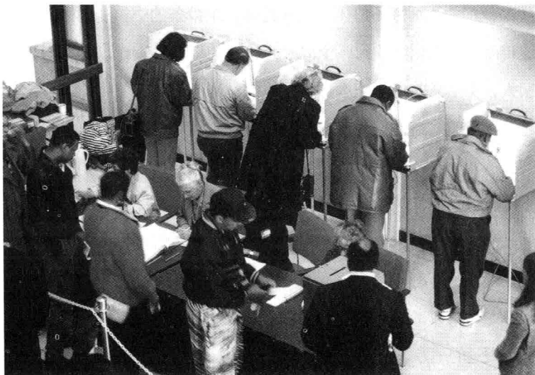
选民登记和电子投票

数一下，也记不得有多少重大事情是必须由我们自己操心选择而决定的，因此，当时我们也并不对自己是否有这样的权利耿耿于怀。这样一来，我大概就成了美国社会里大选年头心情最轻松的一些人中的一个了。