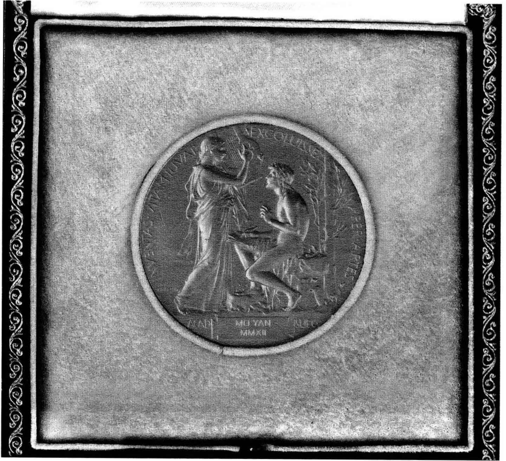
二〇一二年授予莫言諾貝爾文學獎獎章背面