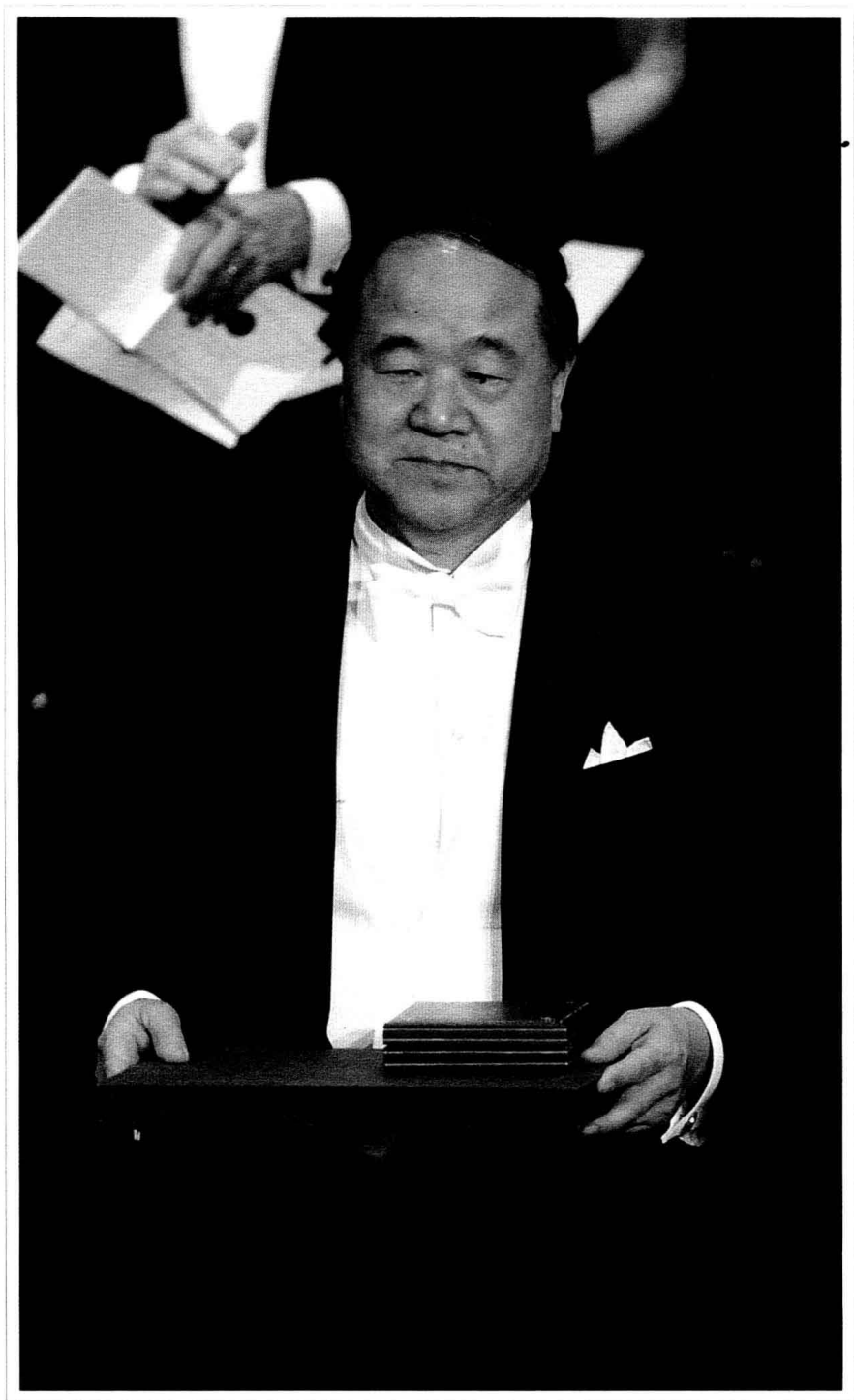
二〇一二年十二月十日莫言在諾貝爾獎頒獎現場