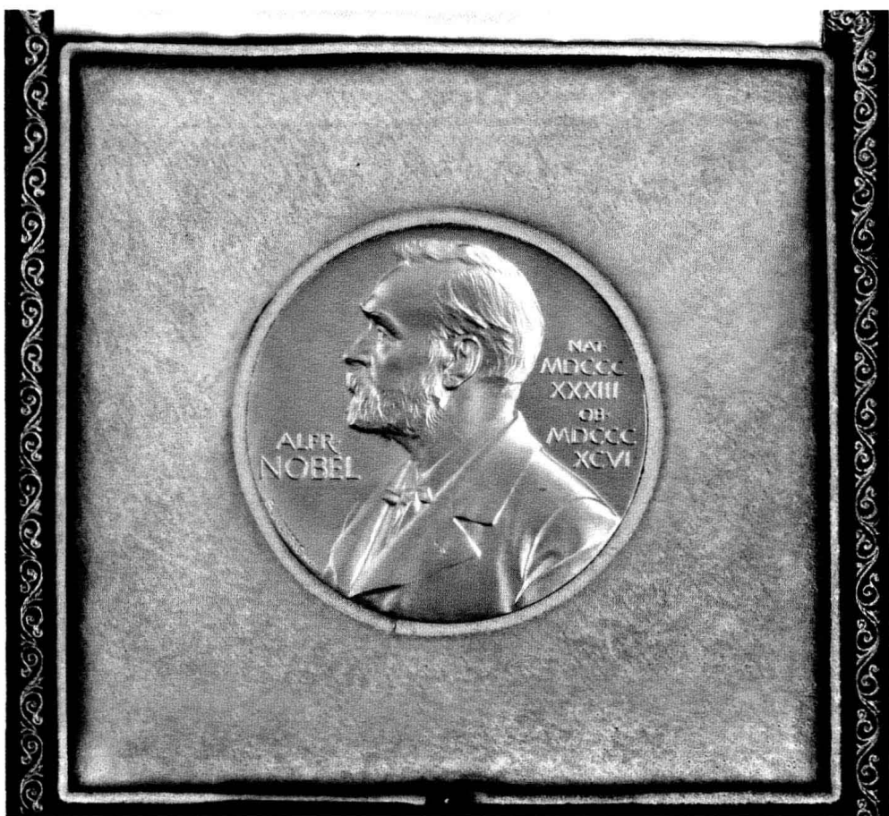
二〇一二年授予莫言諾貝爾文學獎獎章正面