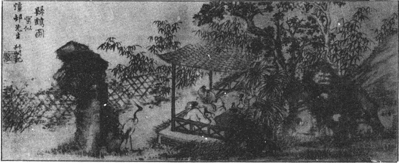
鄭大鶴先生畫歸鶴圖