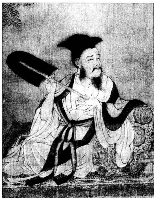
《高逸图》(局部) | 唐代 | 孙位