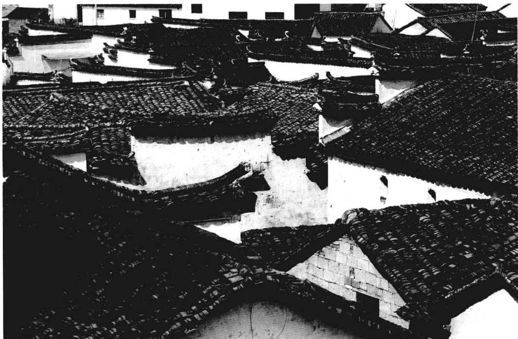
村落丰富变化的屋顶