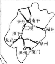
福建省铁路示意图