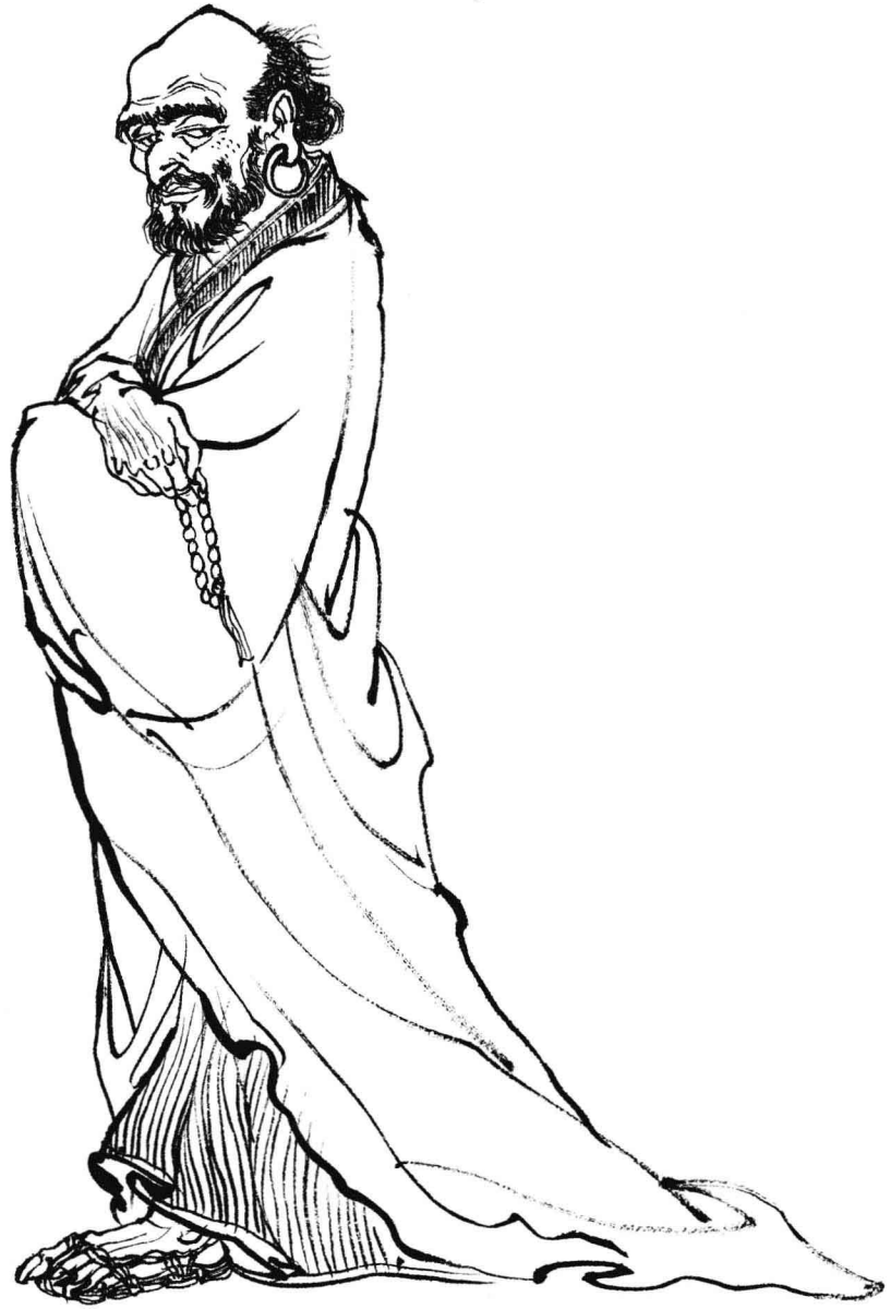
乌巢禅师： 传说他是上古三足金乌变化而成。唐僧师徒赴西天取经途经浮屠山时，他曾向唐僧授予心经。