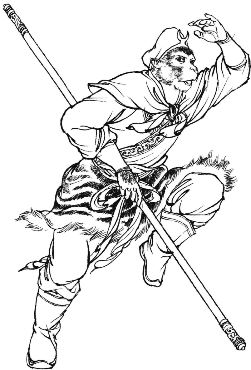
孙悟空（之一） ：法号悟空，唐僧的大徒弟，自称齐天大圣。他曾大闹天宫，被如来佛祖压在五行山下，后来经观世音菩萨点化，保护唐僧西天取经。