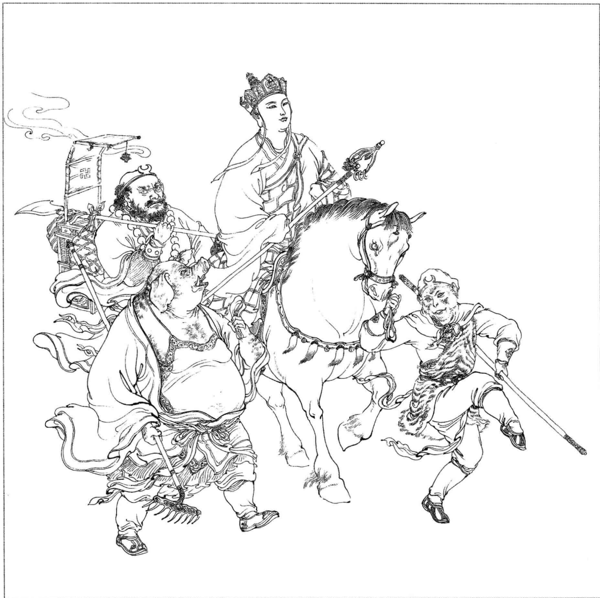
唐僧师徒西天取经