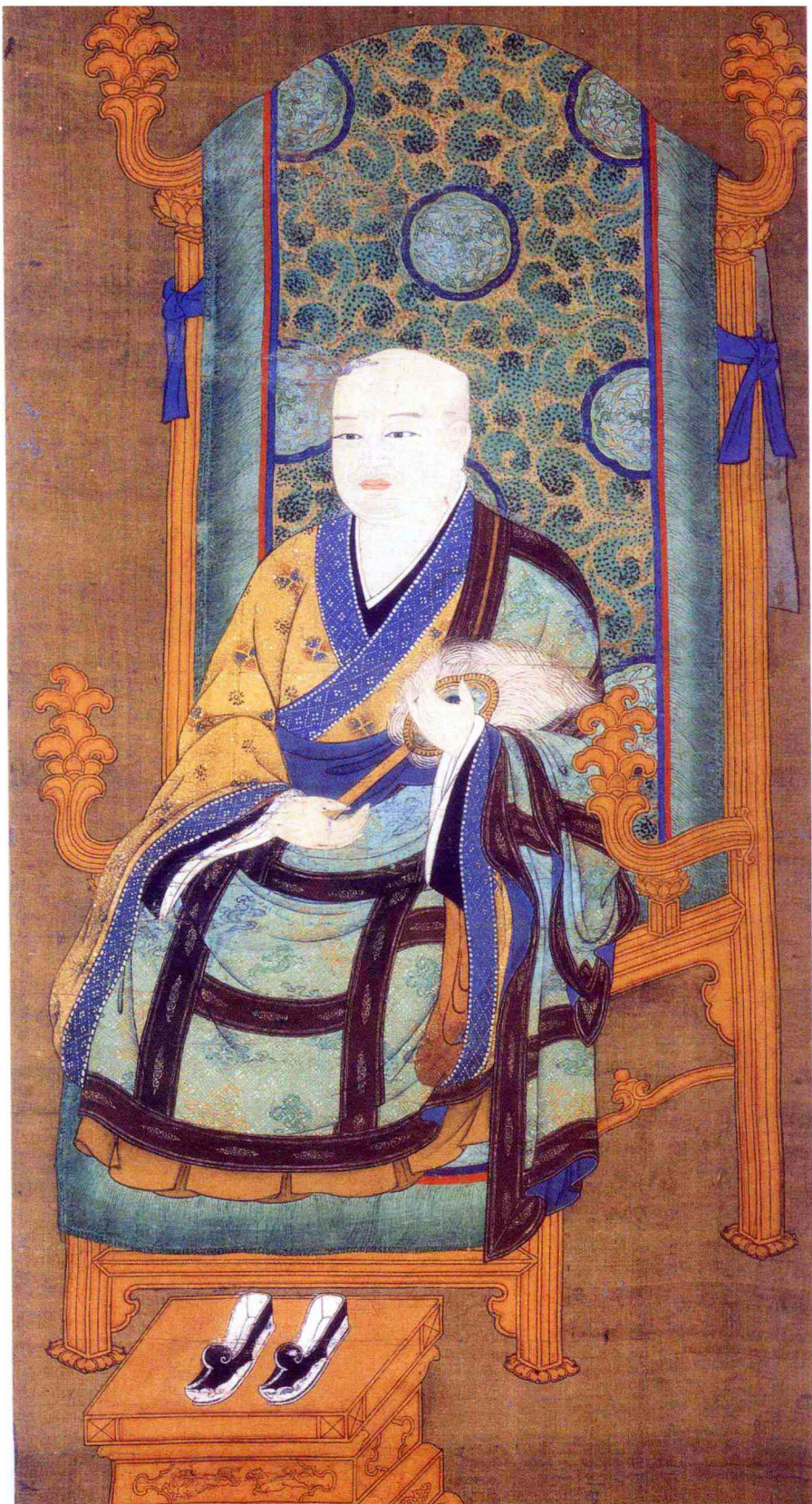
圭峰大师宗密像（日本奈良东大寺藏）