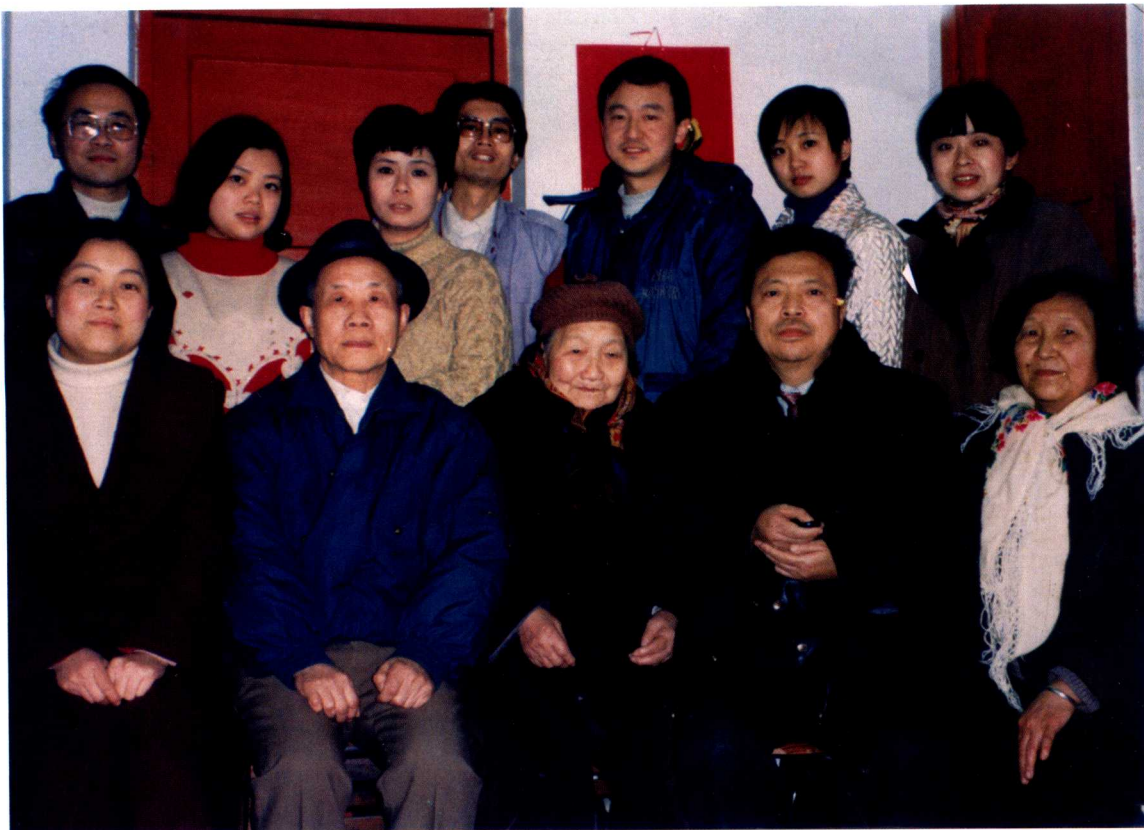
母亲和儿孙在一起