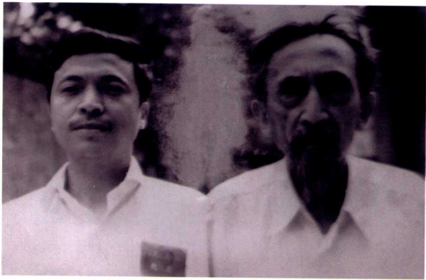
父子在资中县人大政协会上