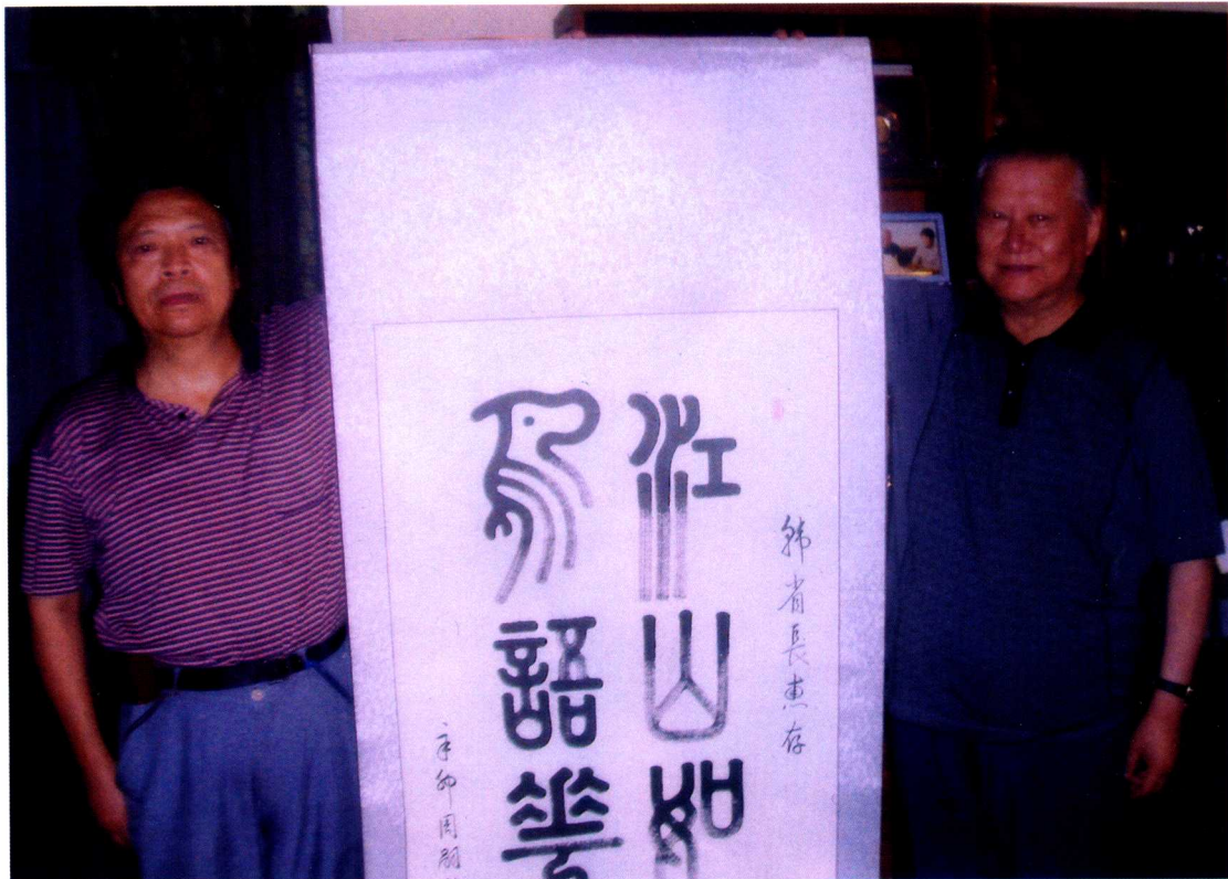
赠原四川省副省长韩邦彦书法