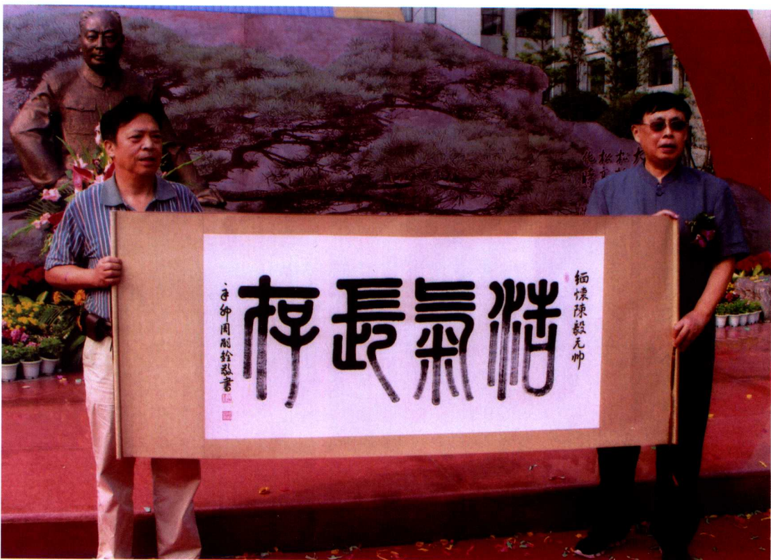
在紀念陳毅元帥誕辰110周年大會上贈陳毅長子陳昊蘇書法