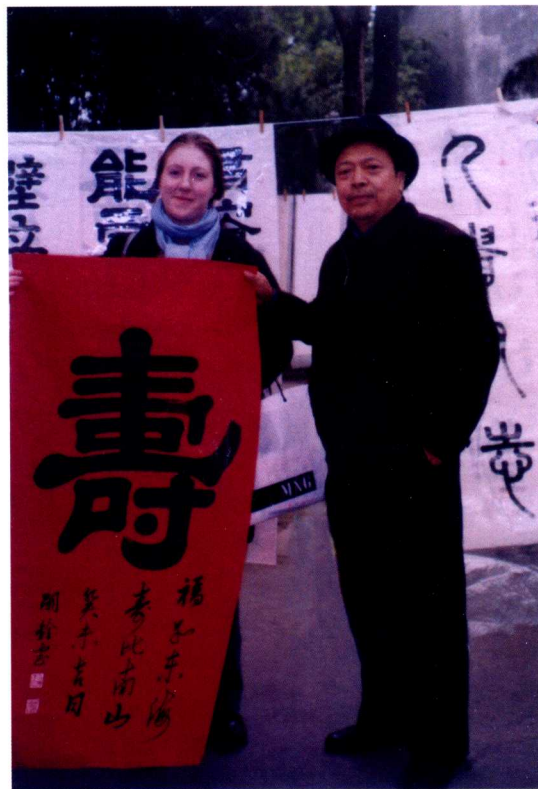
和英国驻广州领事馆领事在书法作品前合影