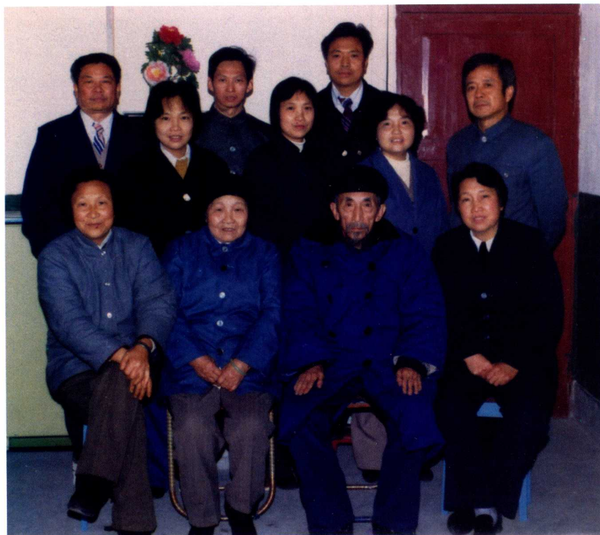
父母和儿女在一起