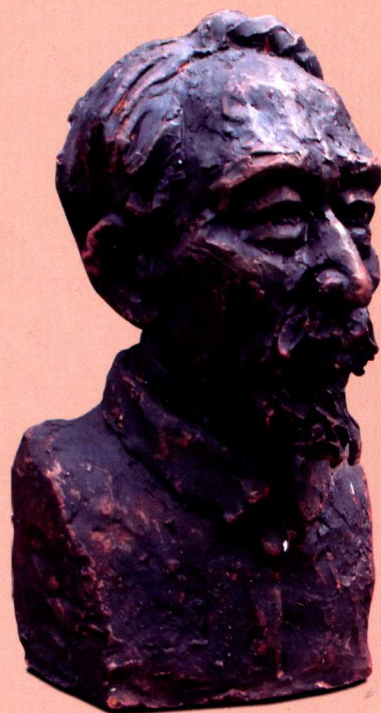
周 叔 平 雕 像