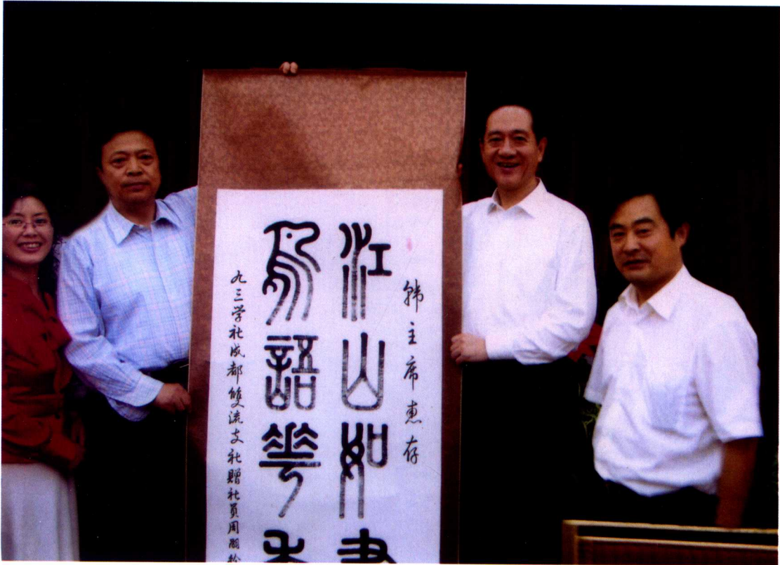
贈書法給九三學社主席、全國人大副委員長韓啟德 從右起：蒲光樹、韓啟德、周嗣銓、李芳平