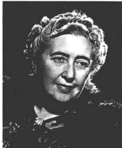
阿加莎·克里斯蒂 Agatha Christie (1890—1976)