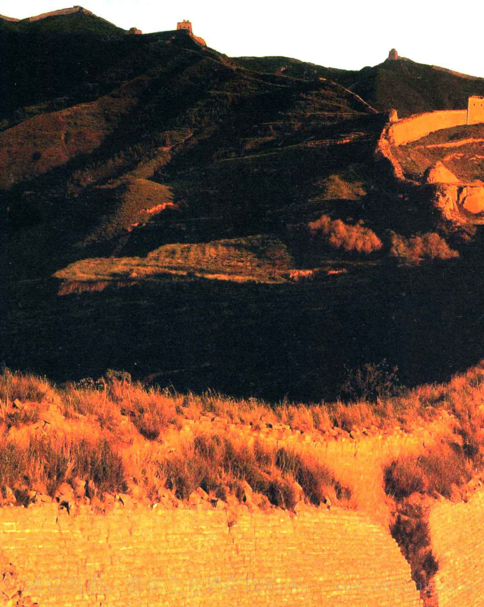
图1-6 雁门关古长城遗迹