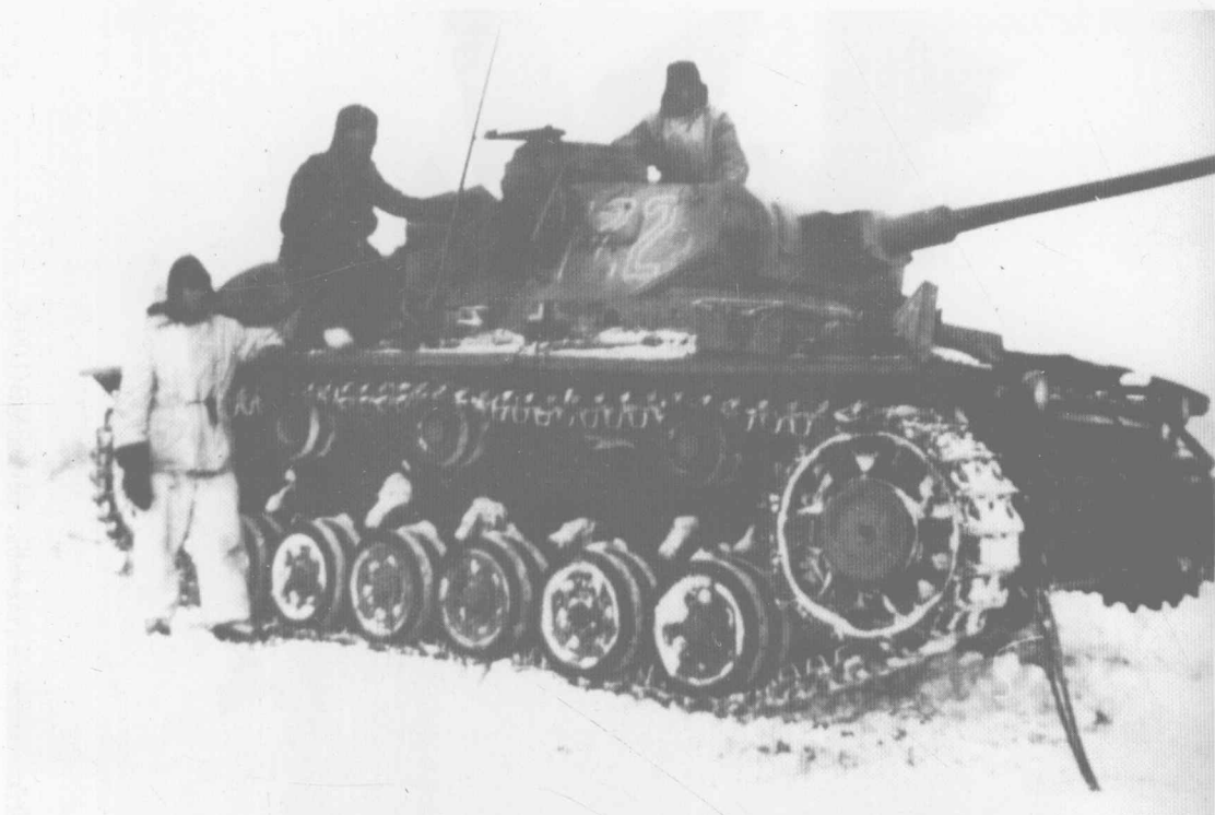
第5“维京”装甲师也为保证罗斯托夫方向撤退道路的畅通展开了一系列激烈地战斗。