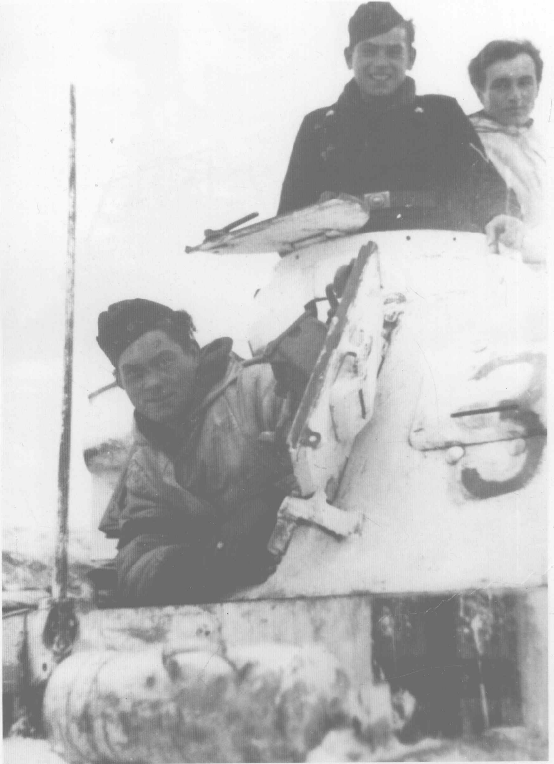
斯大林格勒的惨败使德军丧失斗志，但这些装甲兵看起来似乎还有点信心。