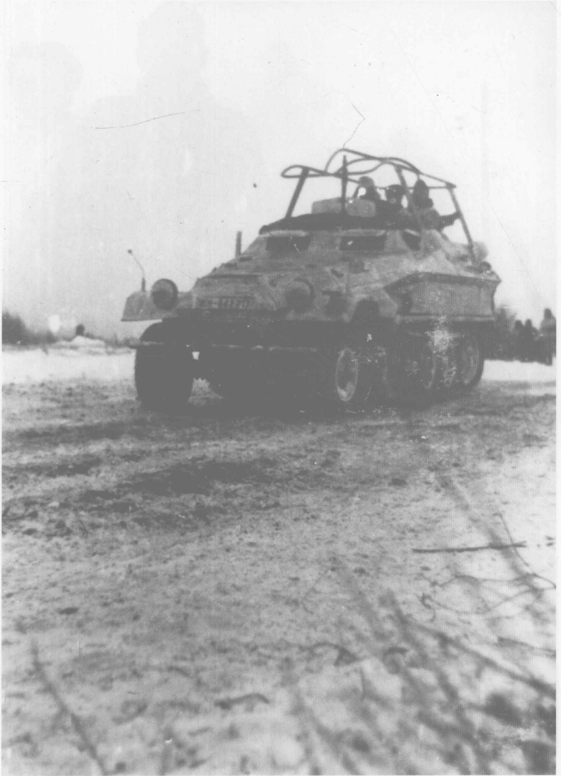
第20装甲师师长海因里希·冯·吕特维茨上校的Sd.Kfz.251/6型指挥车。