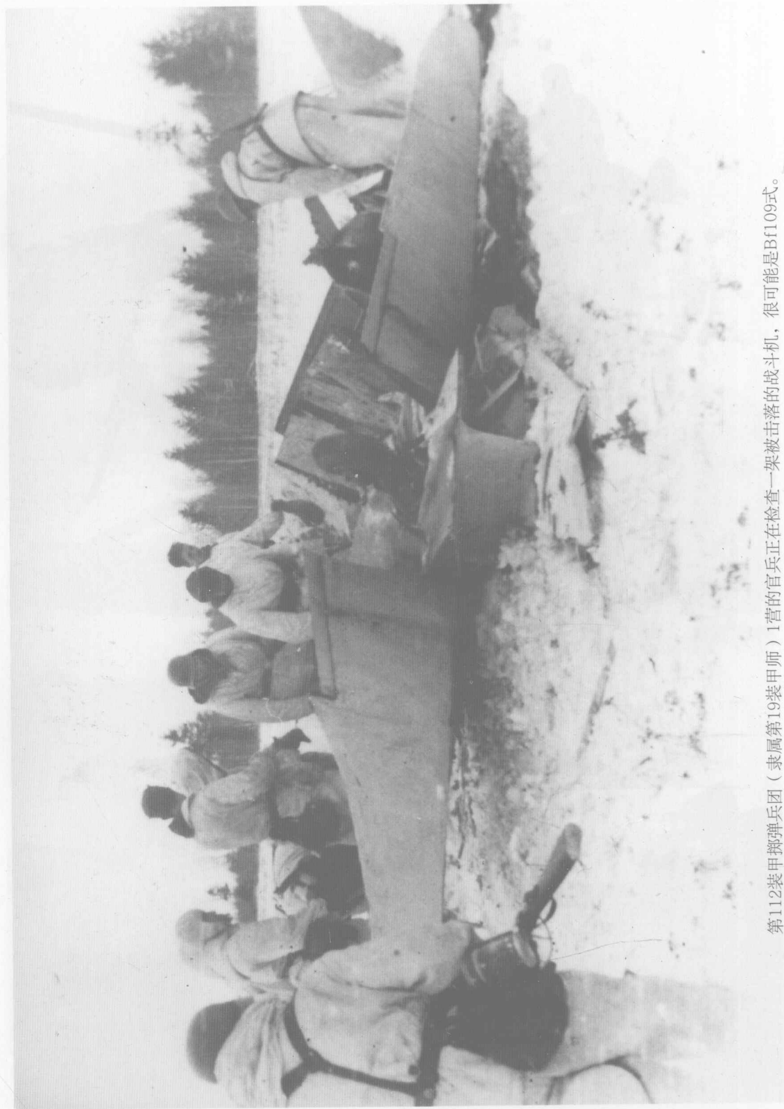
第112装甲掷弹兵团（隶属第19装甲师）I营的官兵正在检查一架被击落的战斗机，很可能是BF109式。