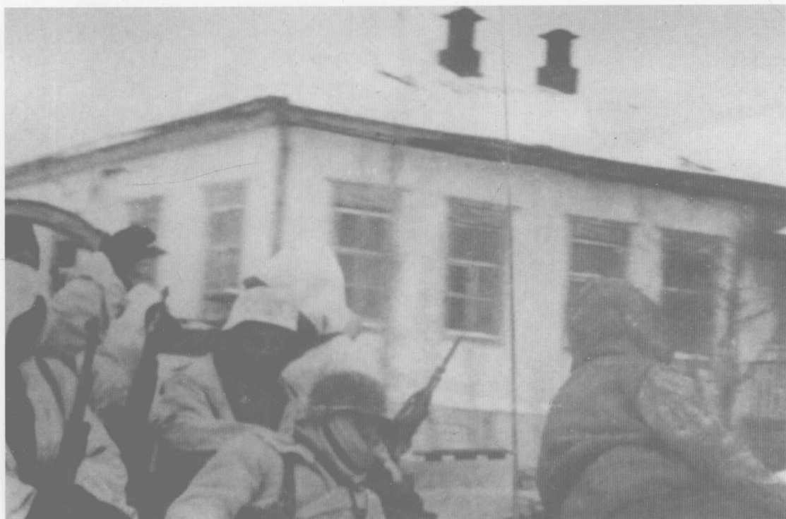
尽管步兵们可以坐在坦克的发动机舱盖上取暖，但是苏联的冬天还是让他们痛苦不堪。