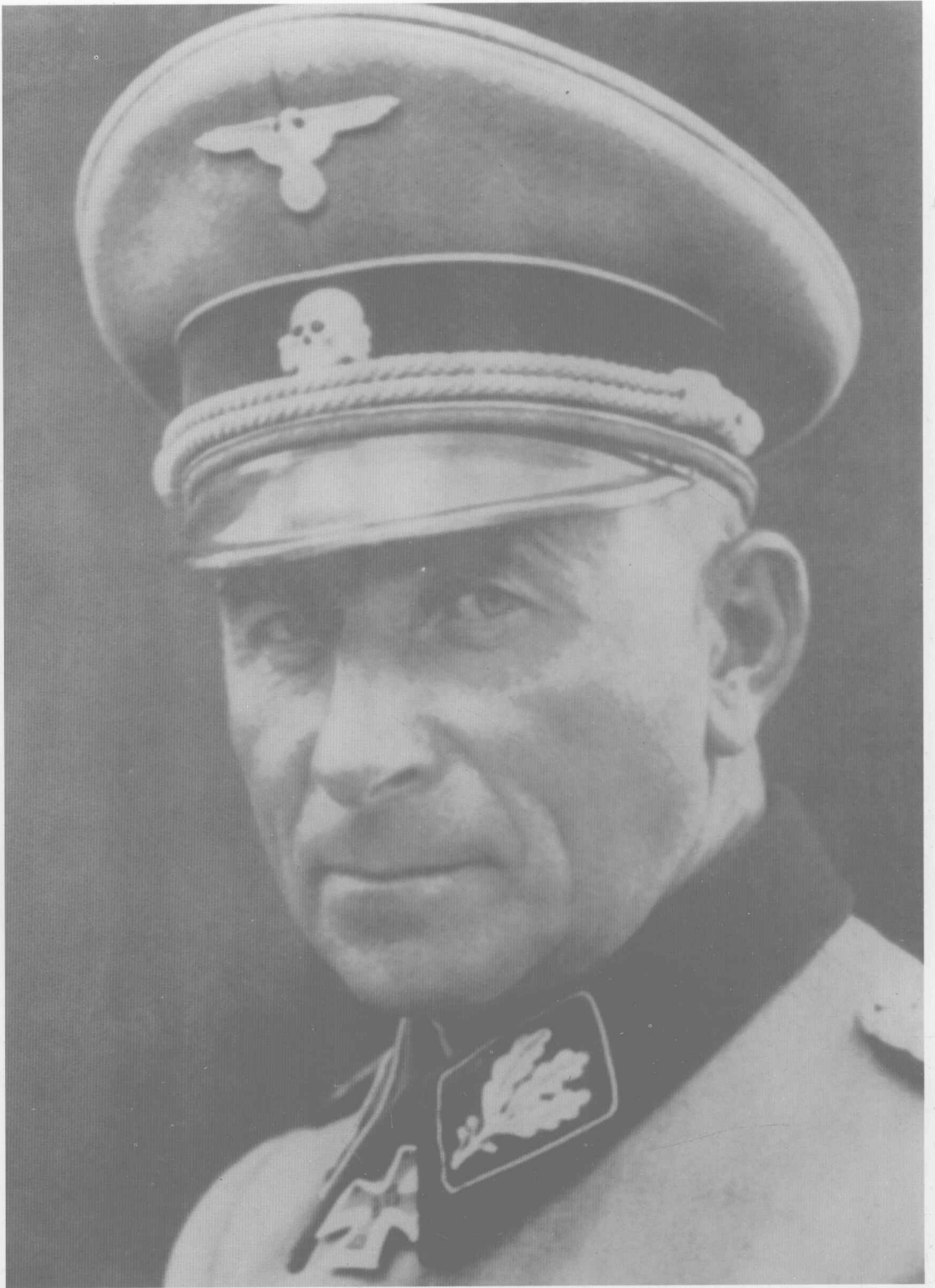
德军主要指挥官——豪塞尔