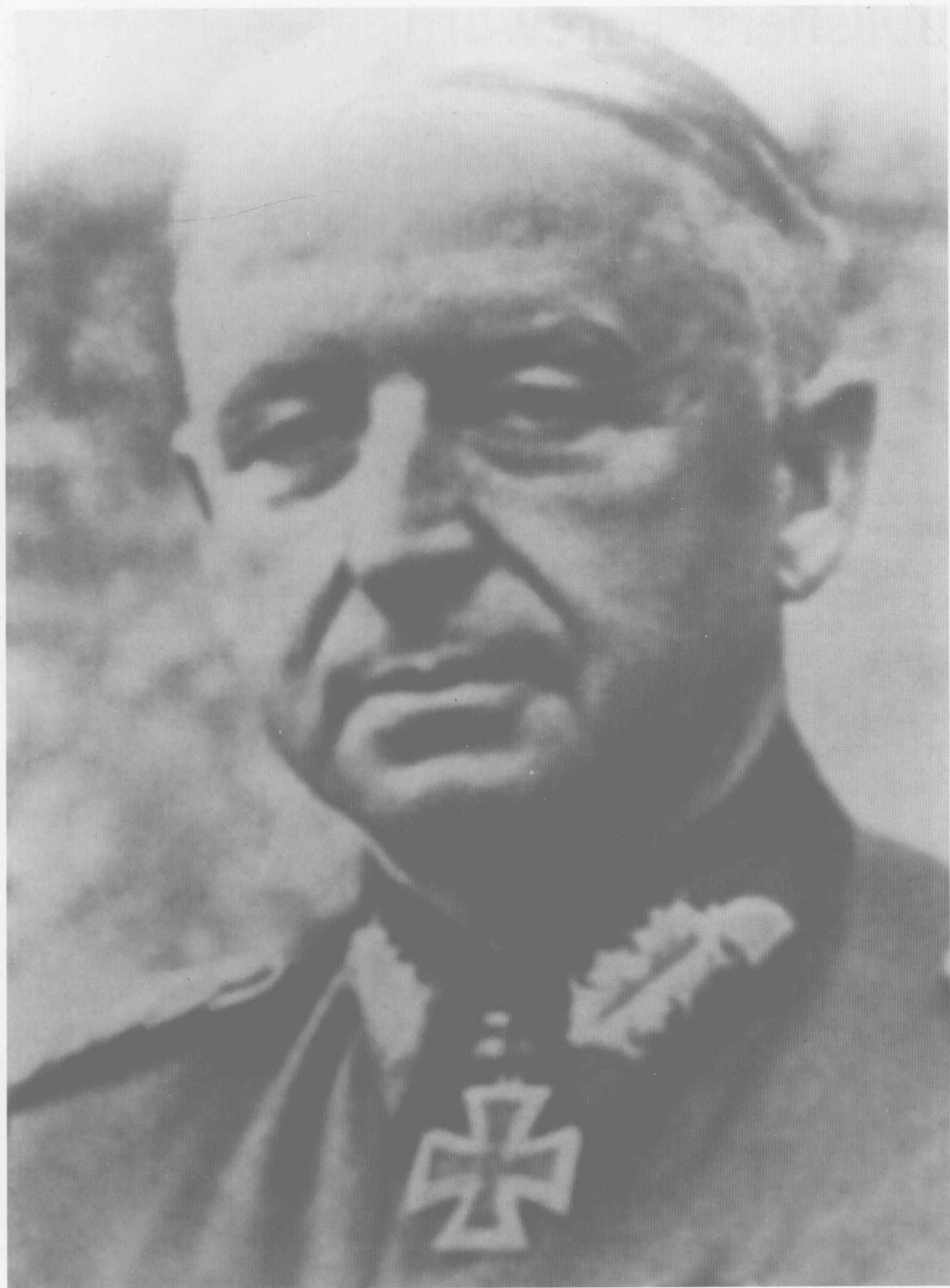
德军主要指挥官——曼施坦因