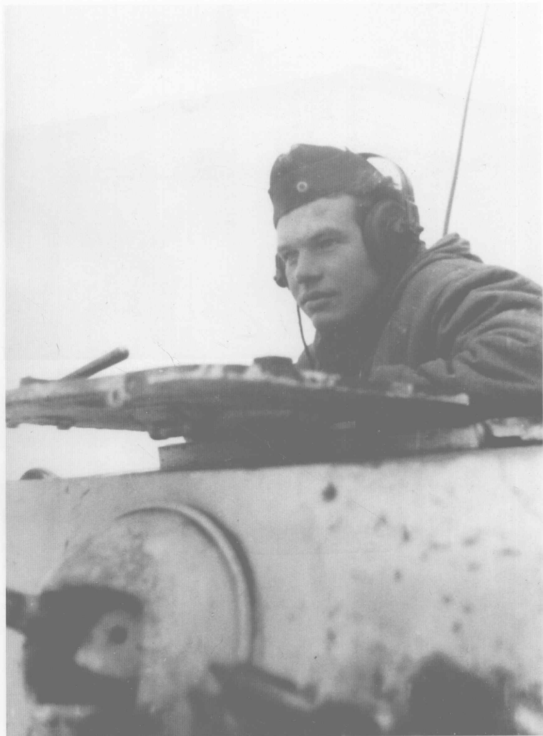
第20装甲师整个12月份都在德库尔巴赫防线上激战，同时在新马尔科夫卡地区（哈尔科夫附近）也能看到他们身影。