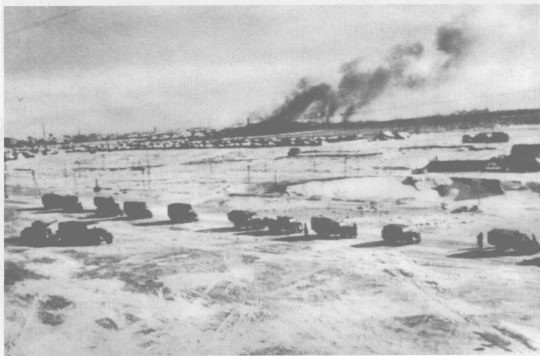
正试图逃离包围圈的德军后勤车队，可能属于第23装甲师。