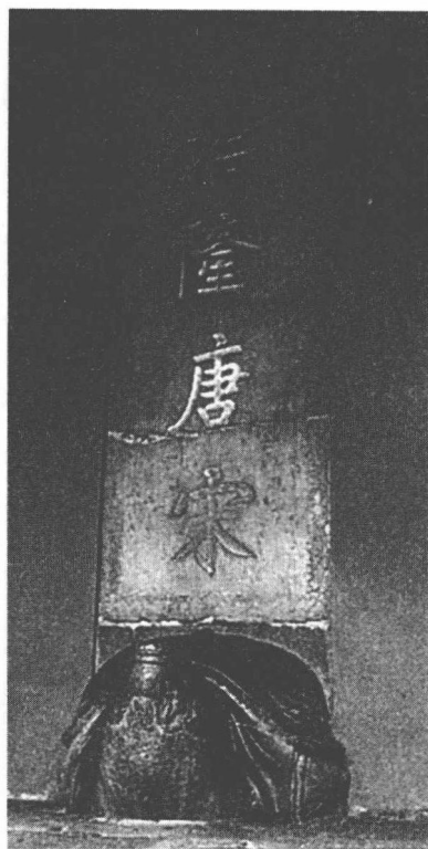
清康熙帝为明孝陵题写的“治隆唐宋”碑