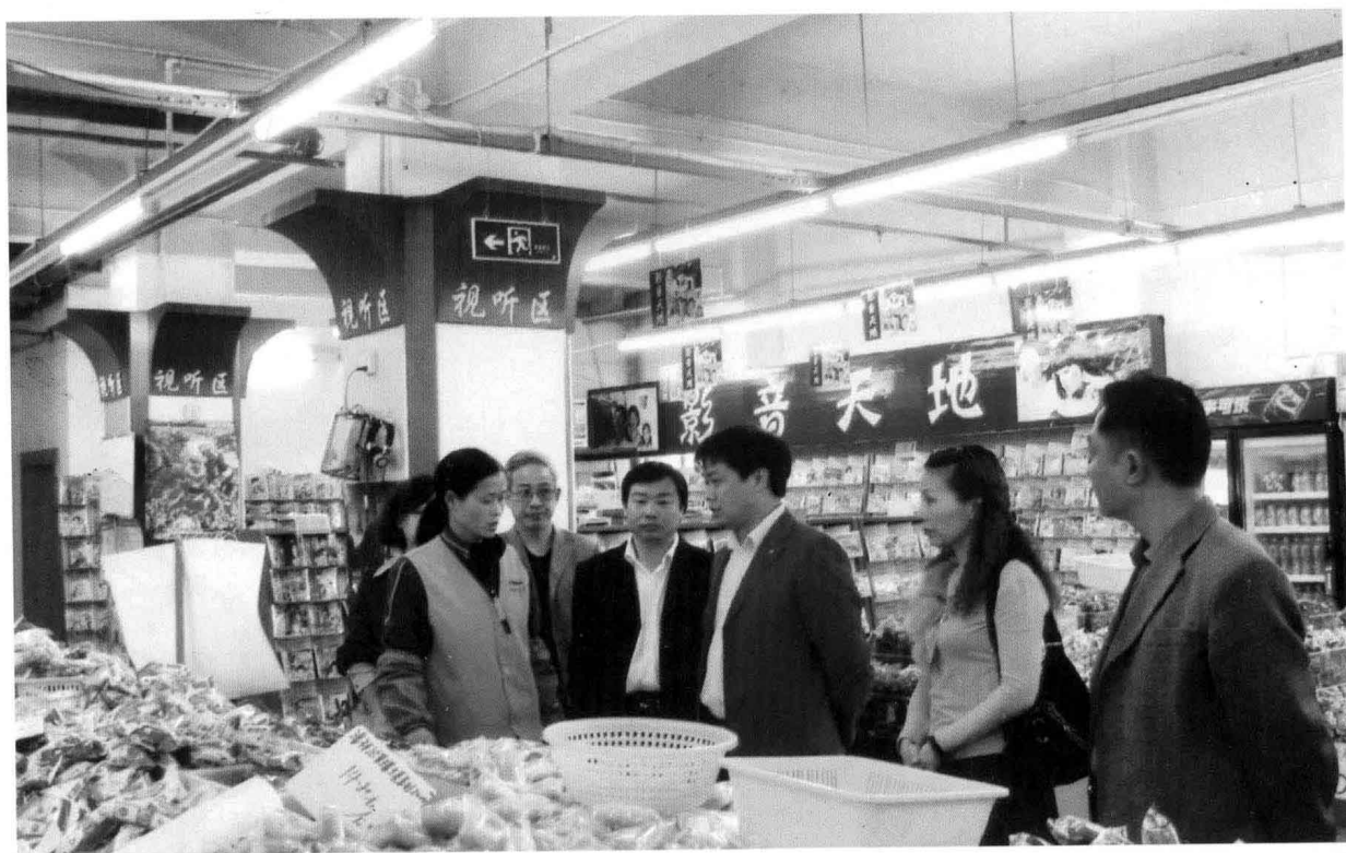
2007年9月，县物价局检查中秋节月饼市场价格。