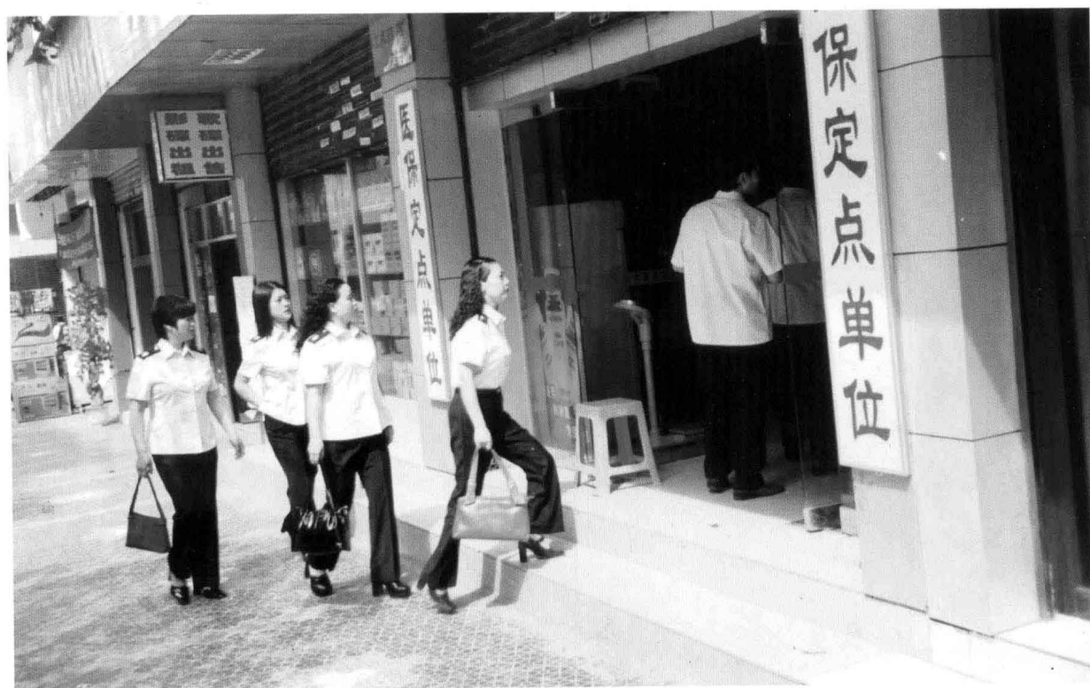
2005年8月，县物价局检查医疗保障定点单位药品价格。