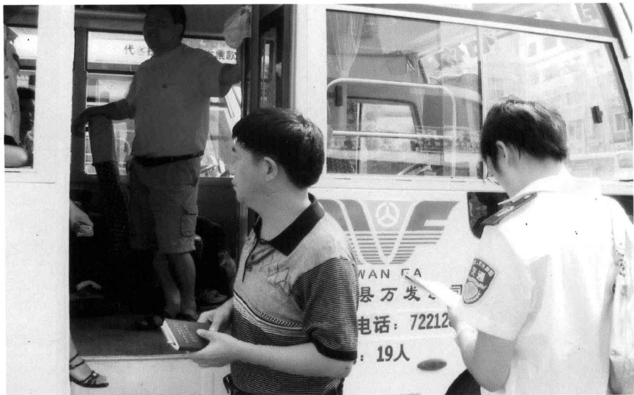
2006年7月，县物价局检查客运票价。