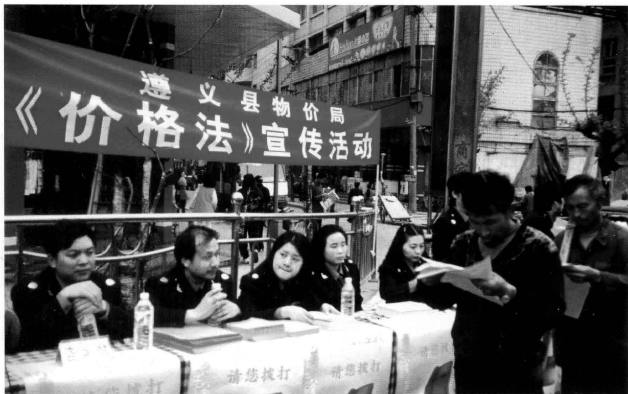
2004年3月，县物价局开展《价格法》宣传活动。