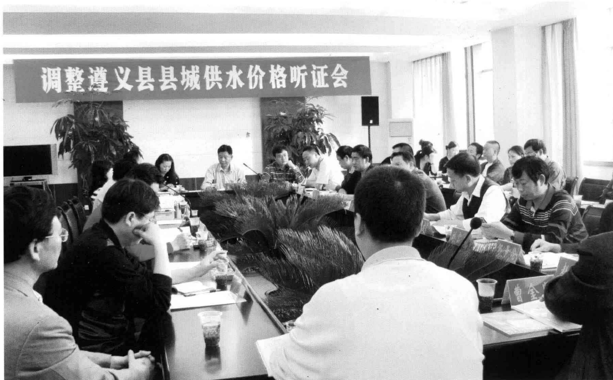
2009年5月，县物价局主持召开调整县城供水价格听证会。