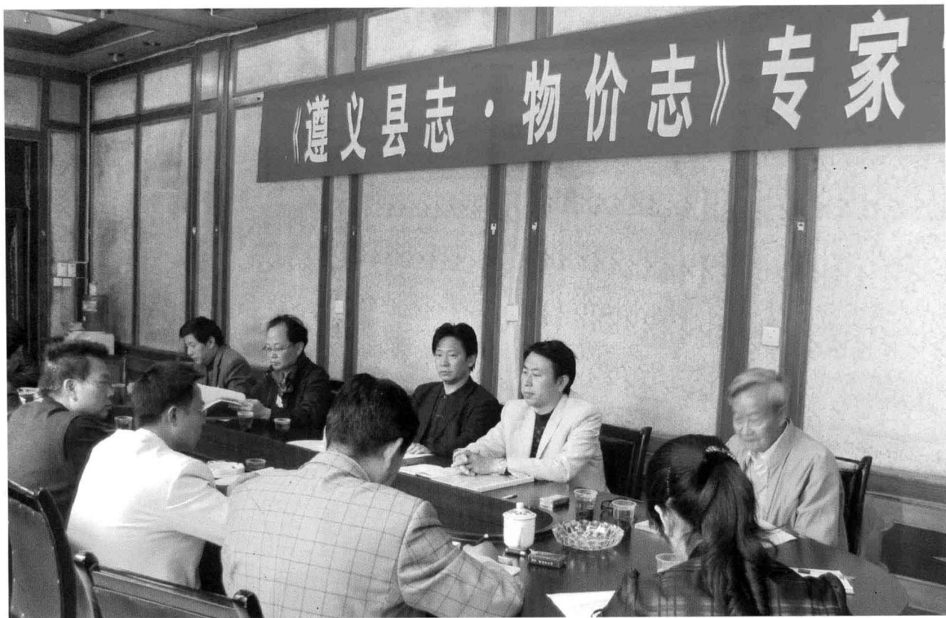
2010年4月9日，《遵义县志·物价志》专家评审会。