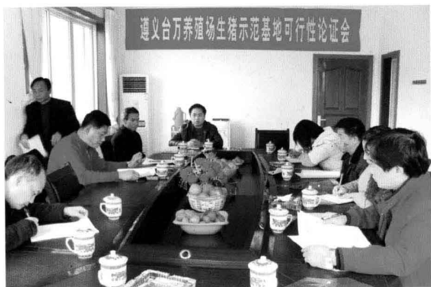
2010年2月6日，县物价局主持召开价格调节基金补助项目可行性论证会。