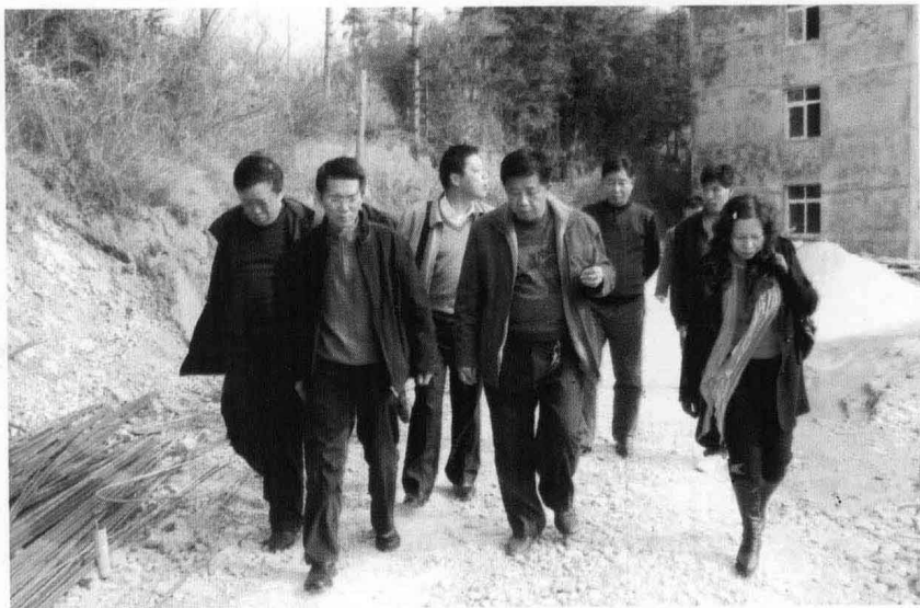
2008年元月，国家 发改委、省物价局领导 在我县调研。