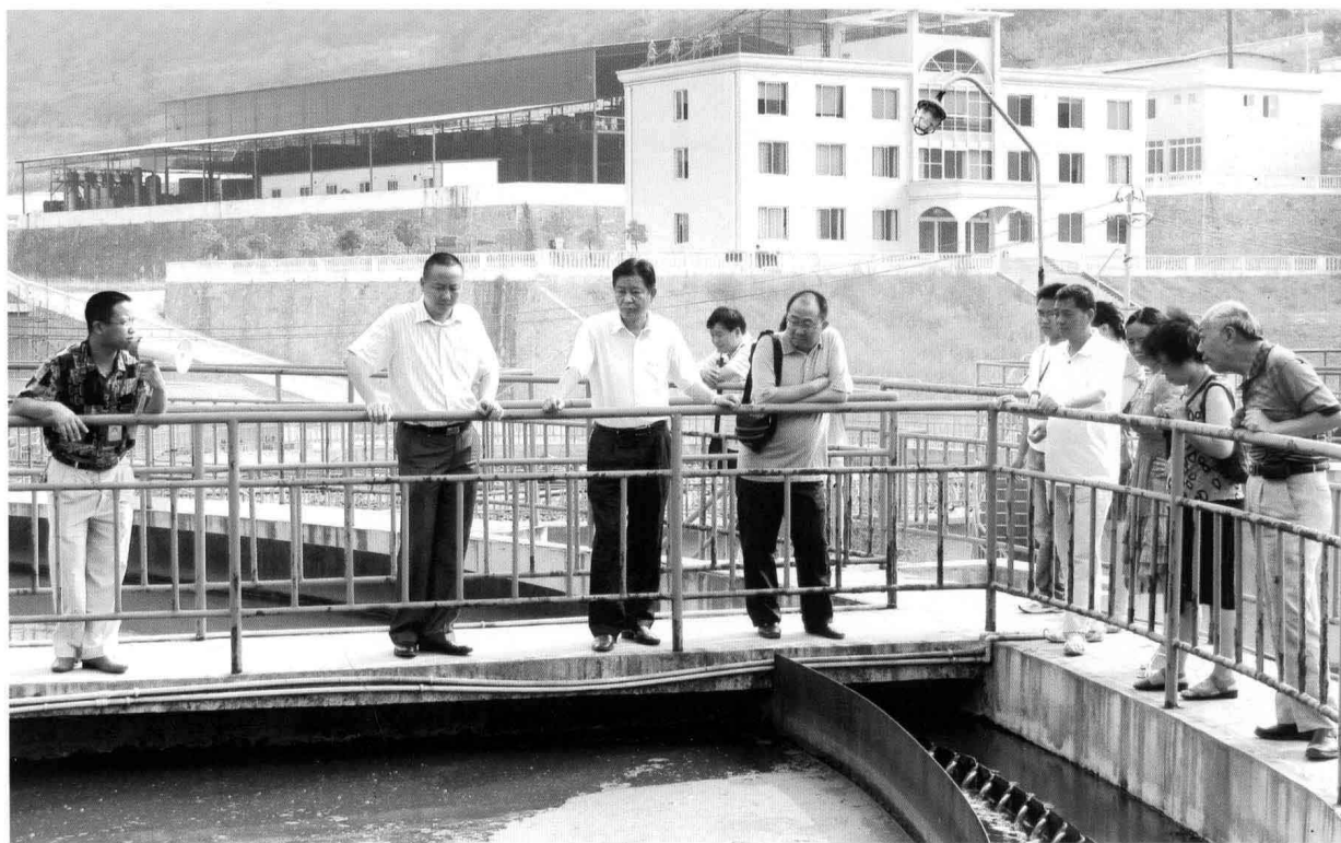
召开调整县城污水处理费听证会前，听证参加人实地考察污水处理厂。