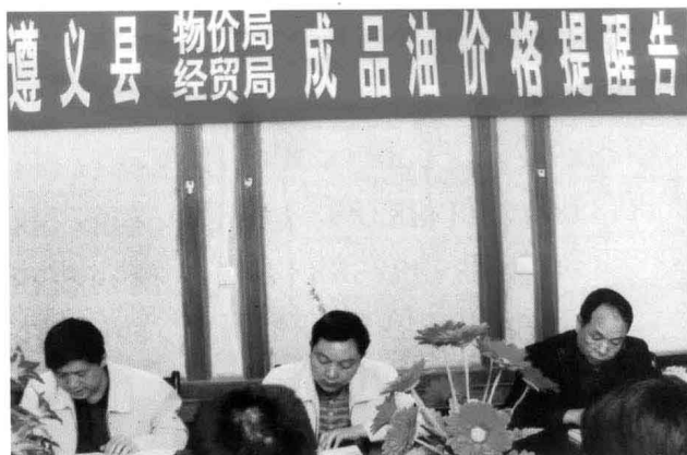
2008年11月，主持召开提醒告诫会。