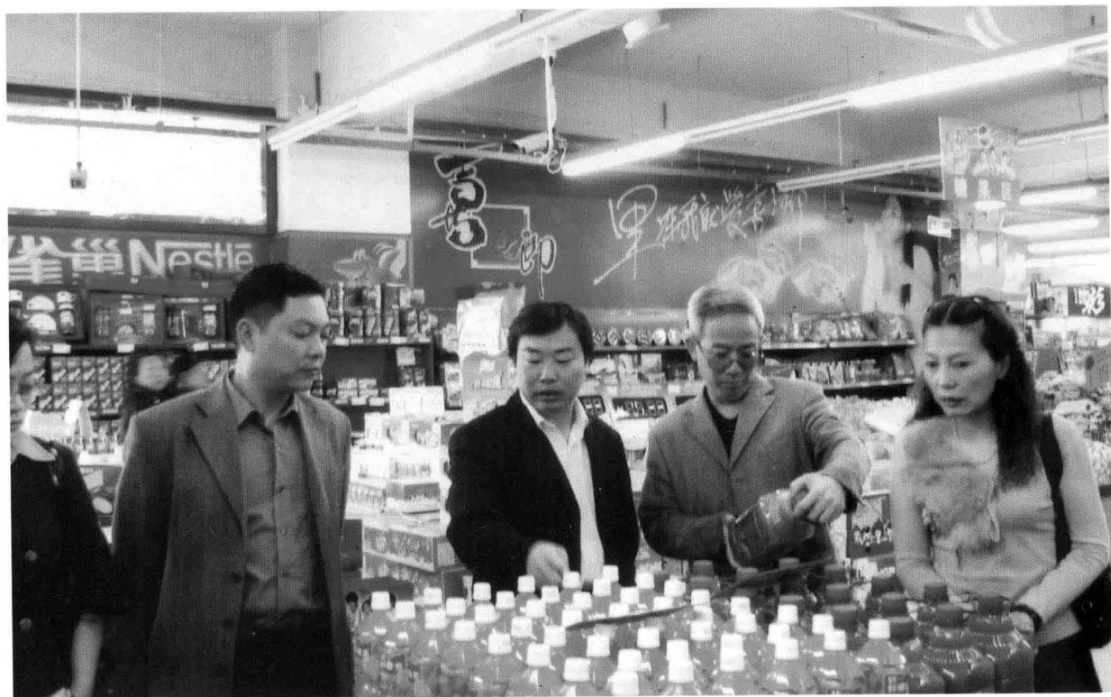
2007年9月，县物价局检查市场商品价格。