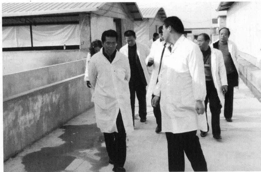
2008年元月，国家 发改委、省、市物价局 领导到我县调研规模生 猪饲养情况。