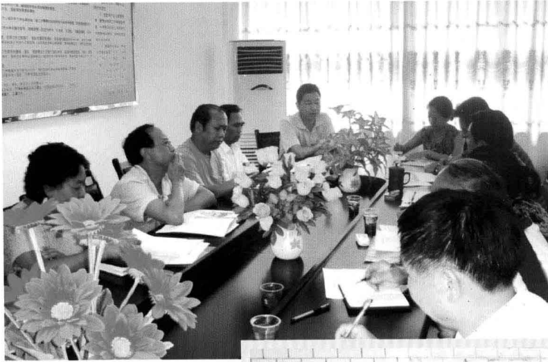
2007年8月，开展民主 行风评议活动。