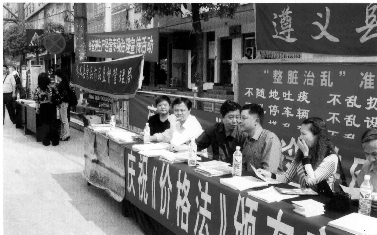
2007年5月，县物价局进行价格法律、法规、政策宣传。