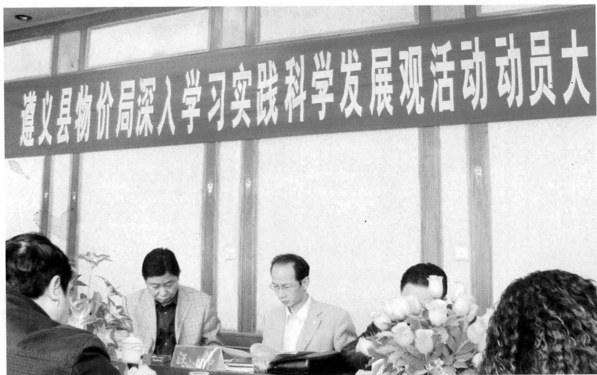
2008年3月，遵义县物价局开展深入学习实践科学发展观活动。