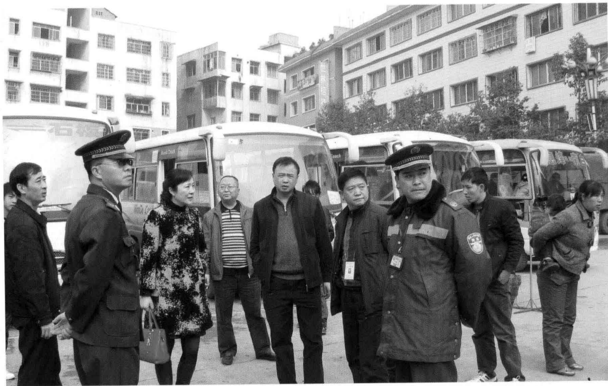
2009年2月，省、市、县物价局干部检查我县客运市场的春运票价。