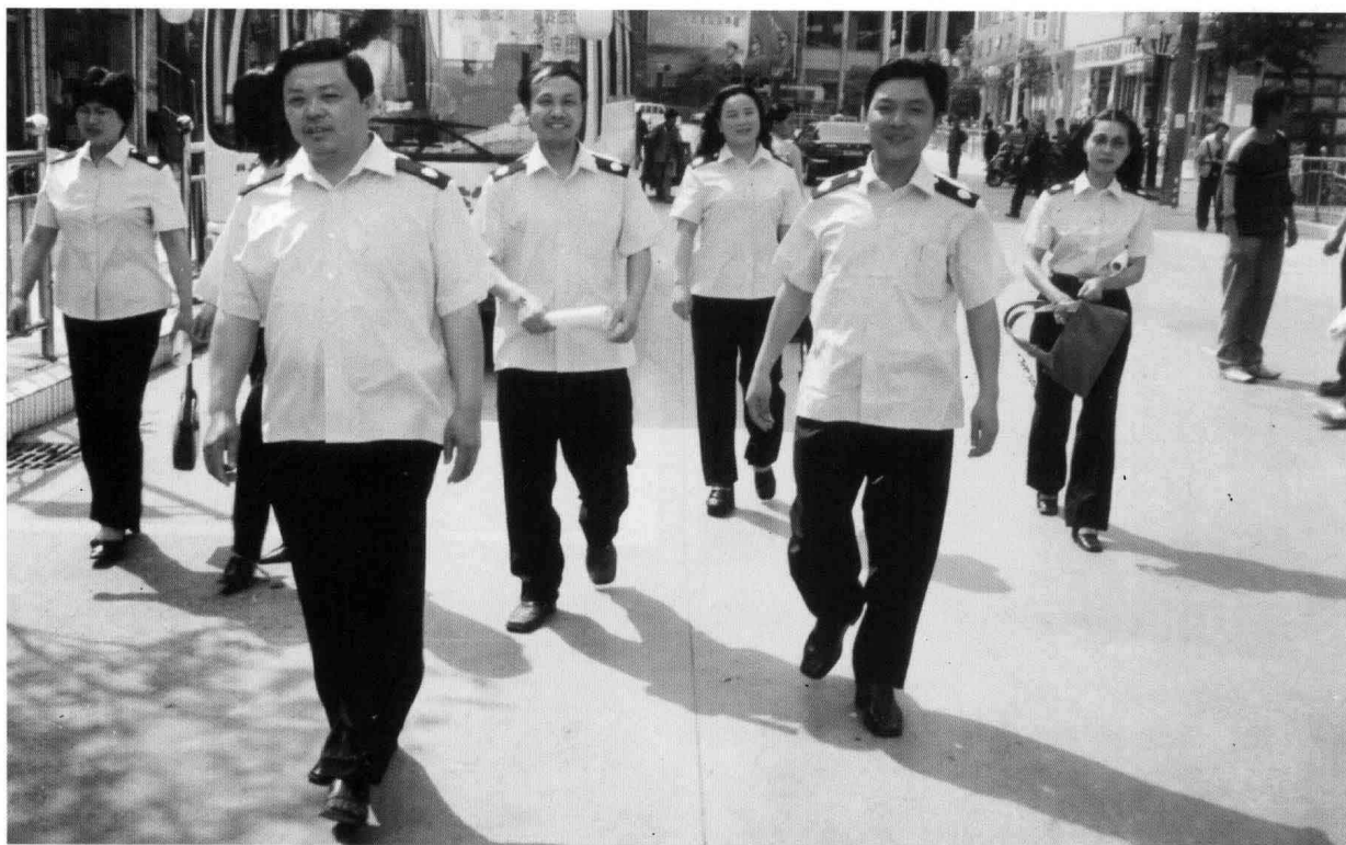
2004年6月，县物价局对县城商品市场价格进行检查。