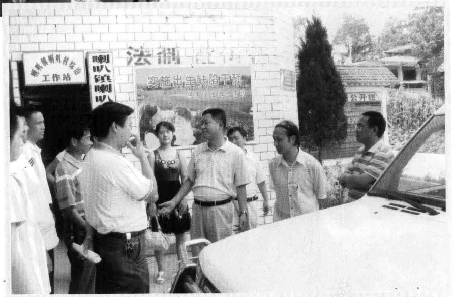
2009年6月，县物价局到 喇叭镇开展“城乡结对子、 联动共创建”活动。