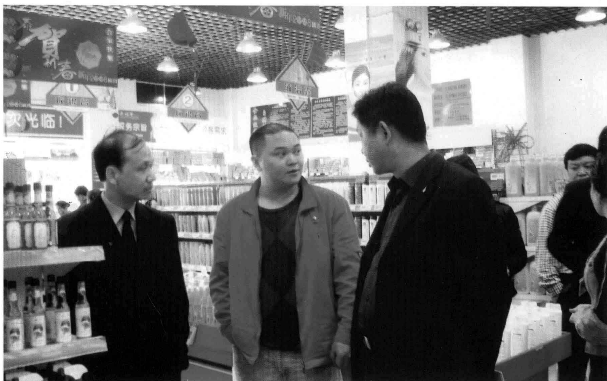
2008年10月，县物价局进行明码标价检查。