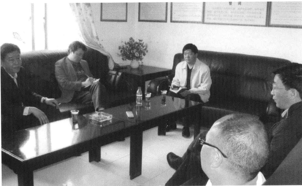
2007年4月13日， 县物价局领导现场答 复政协委员的提案。