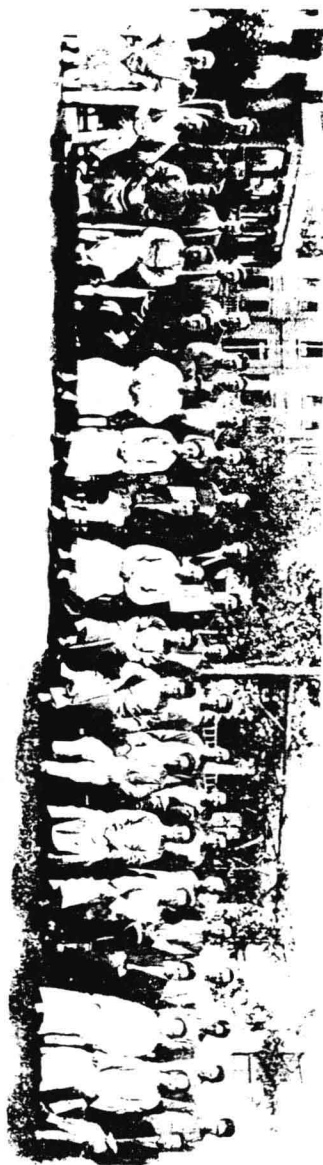
委 員 及 編 輯 組 像