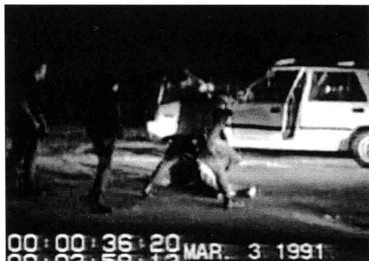
罗德尼·金被警察殴打的录像一遍遍地播放

的今天，我们仍然时不时地在电视里看到这段录像。我们相信，在今后的许许多多年里，这段录像还将经常出现在美国的各种电视专题节目里，比如说，讨论司法公正的，讨论警察权限的等等。当然更多的，就是出现在讨论种族问题的电视节目上。