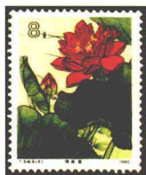
荷花“佛座莲” 中国 1980