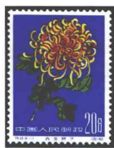
菊花“赤金狮子” 中国 1960