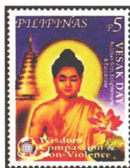
佛与莲花 菲律宾 2002