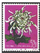
菊花“天鹅舞” 中国 1960