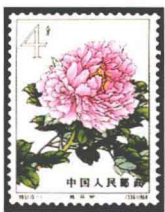
牡丹“胜丹炉” 中国 1964