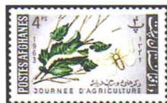
桑叶和蚕 阿富汗 1963

桑树，双子叶植物纲蔷薇目桑科桑属，为落叶乔木，树高可达16米。桑树的根系发达，萌芽力强，长得快，枝条密度中等；能抗旱耐寒，也比较耐温耐湿，是水土保持、固沙的好树种。桑树一身是宝，桑叶是喂桑蚕的主要食料；桑树木材可以制家具、农具，并且可以作小建筑用材；桑皮可以造纸；桑条可以编筐；桑葚可以酿酒。由于桑树具有很高的经济价值，尤其蚕丝是上等的纺织原料，深受阿富汗人民的喜爱，将它定为国树。