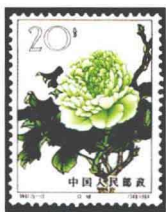
牡丹“豆绿” 中国 1964