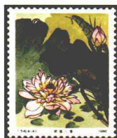
荷花“娇容三变” 中国 1980