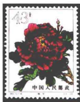
牡丹“紫魏” 中国 1964