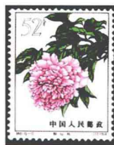
牡丹“醉仙桃” 中国 1964