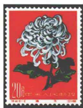
菊花“温玉” 中国 1960