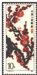
梅花“朱砂” 中国 1985

要求，建议当选国花，可在梅花、牡丹、菊花、荷花四种花卉中考虑。他们还建议，在确定我国国花的同时，推动各省、市、自治区确定省花、区花、市花，把爱国和爱家乡结合起来，使我们的国家成为鲜花绚丽的乐园。