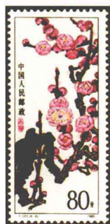
梅花“杏梅” 中国 1985