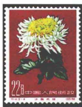
菊花“冰盘托桂” 中国 1960

1983年10月在中国植物学会成立五十周年代表大会上，全体代表向全国人民代表大会常务委员会提出建议，望能及早正式确定我国国花；并根据广大群众的