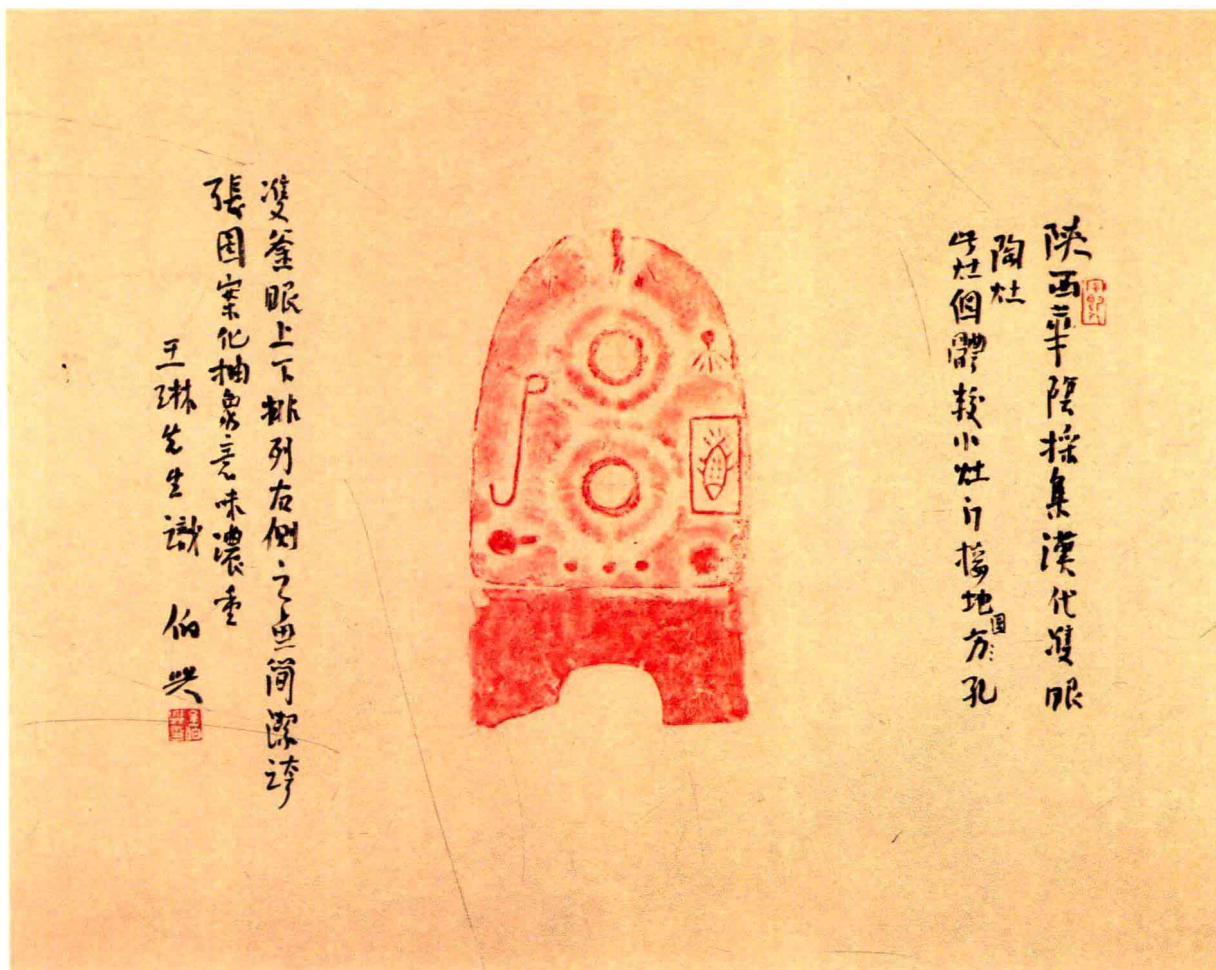
题记文字：陕西华阴采集。汉代双眼陶灶。此灶个体较小，灶门接地圆孔，双釜眼上下排列，右侧之鱼简洁夸张，图案化抽象意味浓重。王琳先生识，伯兴。