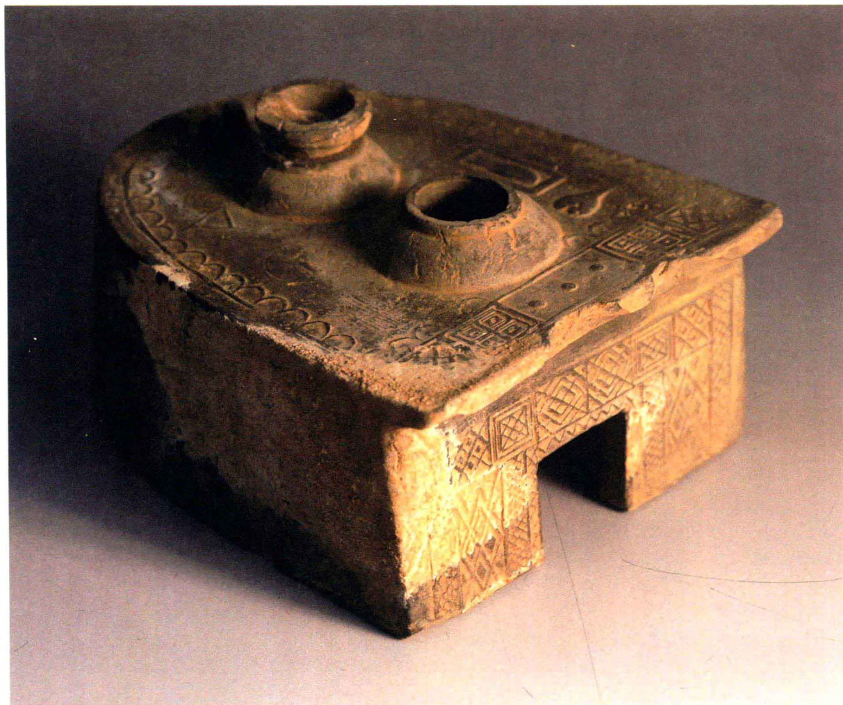
名称：马蹄形双眼陶灶 年代：汉 采集地：陕西华阴 尺寸：15.5厘米×19.7厘米×7厘米