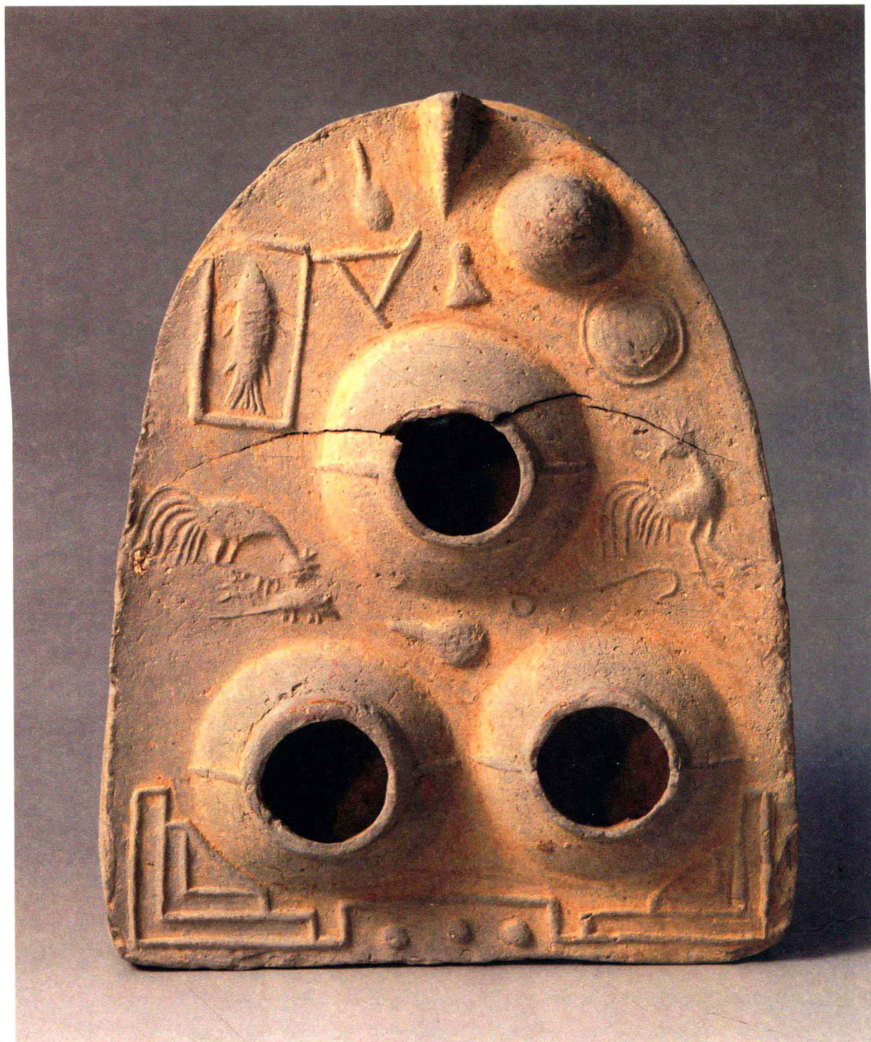
名称：马蹄形三眼陶灶 年代：汉 采集地：陕西华阴 尺寸：14厘米×18.2厘米×6.2厘米