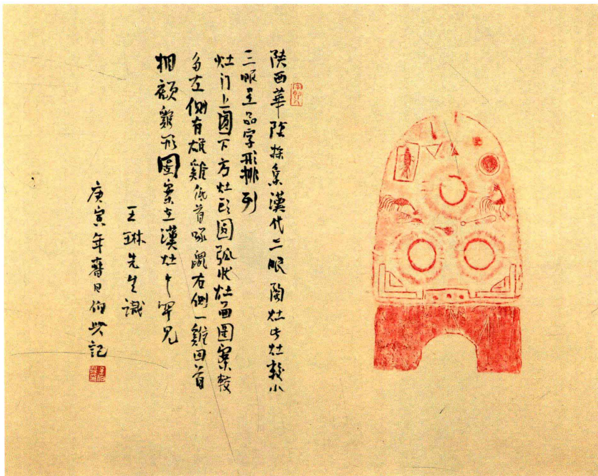
题记文字：陕西华阴采集。汉代三眼陶灶。此灶较小，三眼呈品字形排列，灶门上圆下方，灶头圆弧状。灶面图案较多，左侧有雄鸡低首啄鼠，右侧一鸡回首相顾。鸡形图案在汉灶中罕见。王琳先生识，庚寅年春日，伯兴记。