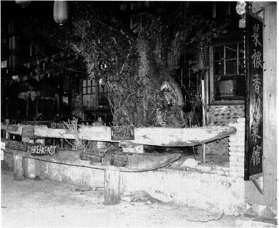
导一 1 泸沽湖边，昔日的生产工具：猪笼船已经演化成为一种文化符号。这是一种生活方式的消亡，还是一种文化的重生？

之后，苏珊·朗格具体剖析了各种艺术符号的特征，并进一步补充和完善了艺术符号学的艺术本体论。她把艺术定义为“人类情感的符号形式的创造” ① 。她认为，艺术作为一种符号，既具有符号的一般意义上的多数特征，还有自己独具的特征：一是艺术符号有着自己独特的表现对象。只有艺术才能够表现存在于人的心灵中的那些变幻不定、难以名状的感性经验。二是艺术符号具有一种独特的表现性。她认为，艺术符号是一种不同于语言等推论性符号的典型的表象性符号，任何艺术符号都富有情感表现性。三是艺术符