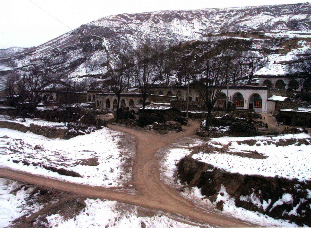
陕北绥德县田庄镇的村落

那些突兀而有力的石镇物。由于其坚硬的材质和人们对其一贯的尊崇，石镇物将过去的表情延续到现在，并将我们的目光投射到了已逝的时间里。不仅如此，在我们接触这些器具的过程里，在它周身的图形密码里，在其特殊的表情和形象之中，我们似乎还能看见与现实重叠着的另一个空间就寄居在巫术与传说的迷雾里。我们祈祷的语言和吟唱的声音在那里四处飘飞。过去和现在，这里与那里，这才是这片土地最真实的生存境遇。这些石头与黄土关乎着我们的身体，关乎着过去和现在可以触摸的历史，关乎着我们那些如云水雾气