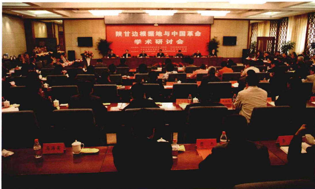
陕甘边根据地与中国革命学术研讨会于2009年9月20日在甘肃省庆阳市召开，中共中央党史研究室副主任李忠杰，中共甘肃省委常委、宣传部部长励小捷，中国延安精神研究会副会长苏希胜等同志出席会议。图为研讨会会场全景