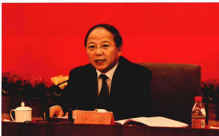
中共甘肃省委常委、宣传部部长励小捷在陕甘边根据地与中国革命学术研讨会上讲话