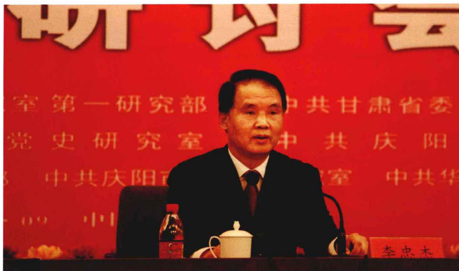
中共中央党史研究室副主任李忠杰在陕甘边根据地与中国革命学术研讨会上讲话