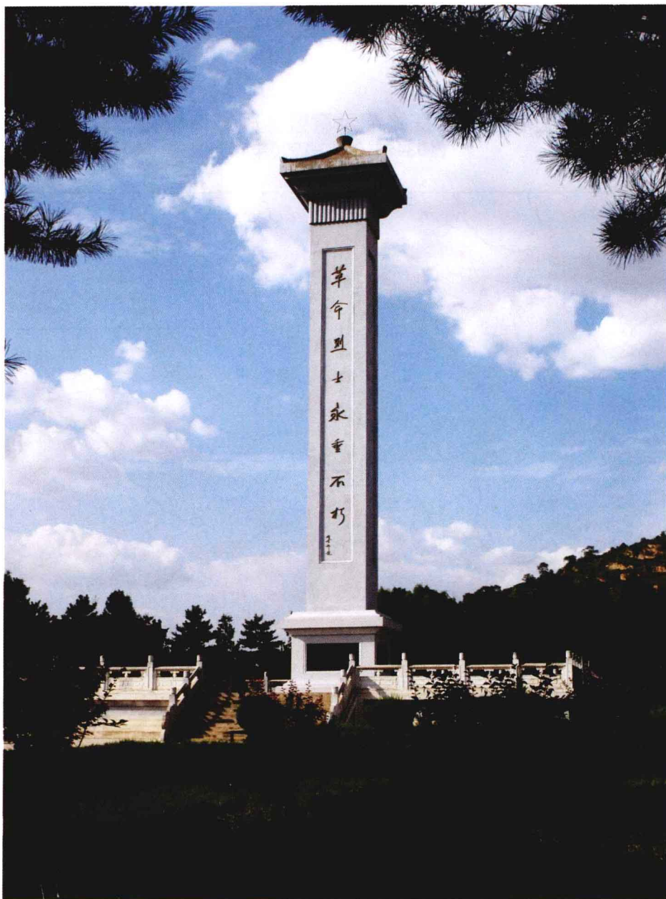
胡耀邦同志题写碑名的南梁革命烈士纪念碑