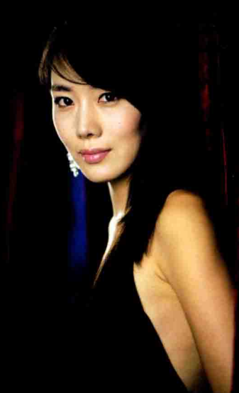
▲ 使用多灯表现人物的立体感