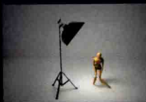
▲ 使用单灯表现人物的动感