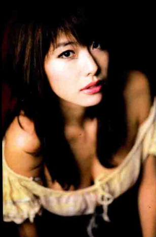
使用长焦镜头拍摄 ▶