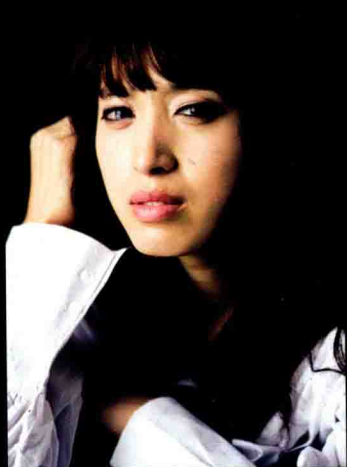
◀ 使用单灯表现人物的悲伤