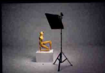
用圆形灯表现人物的性感 ▶