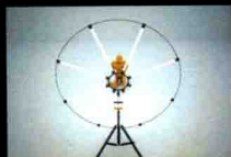
▲ 使用闪光灯打眼神光