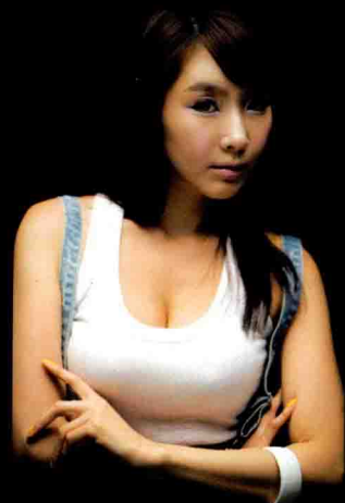
使用多灯表现单灯 感觉的技巧