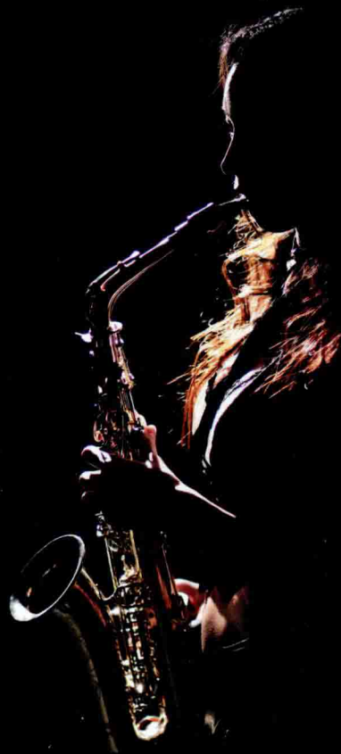
▲ 使用单灯表现人物的轮廓线