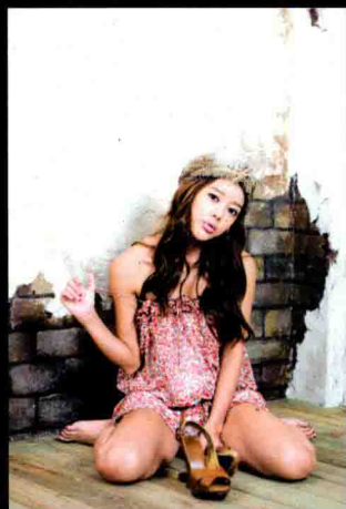
稳定的三角形构图 ▶