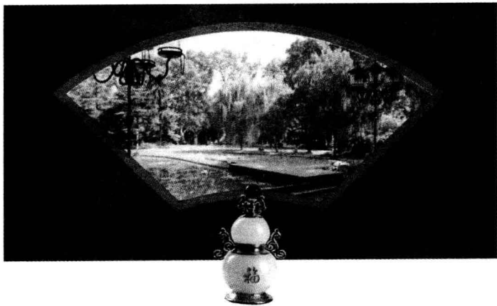
风水学的实质就是运用气场和能量来判断吉凶祸福

有险恶、给人们生活带来不便、困苦和不利的凶地，它不仅对动植物生长产生不良影响，而且也会影响到人的身体健康。2006年7月20日《北京科技报》登载：“地球上有些地方常被人们称为凶地。如果有人由于不知情在那里居住，就会得一些不治之症，科学家称这些地方为土源性致病区。”可见，“凶地”是不好的环境，人们在此得不到健康和幸福，这不是毫无道理的无稽之谈。所以，风水实践的最终目的就是寻找聚集“生气”的吉祥地。