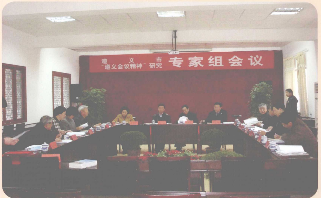
遵义市遵义会议精神课题专家组会议(2011年3月)