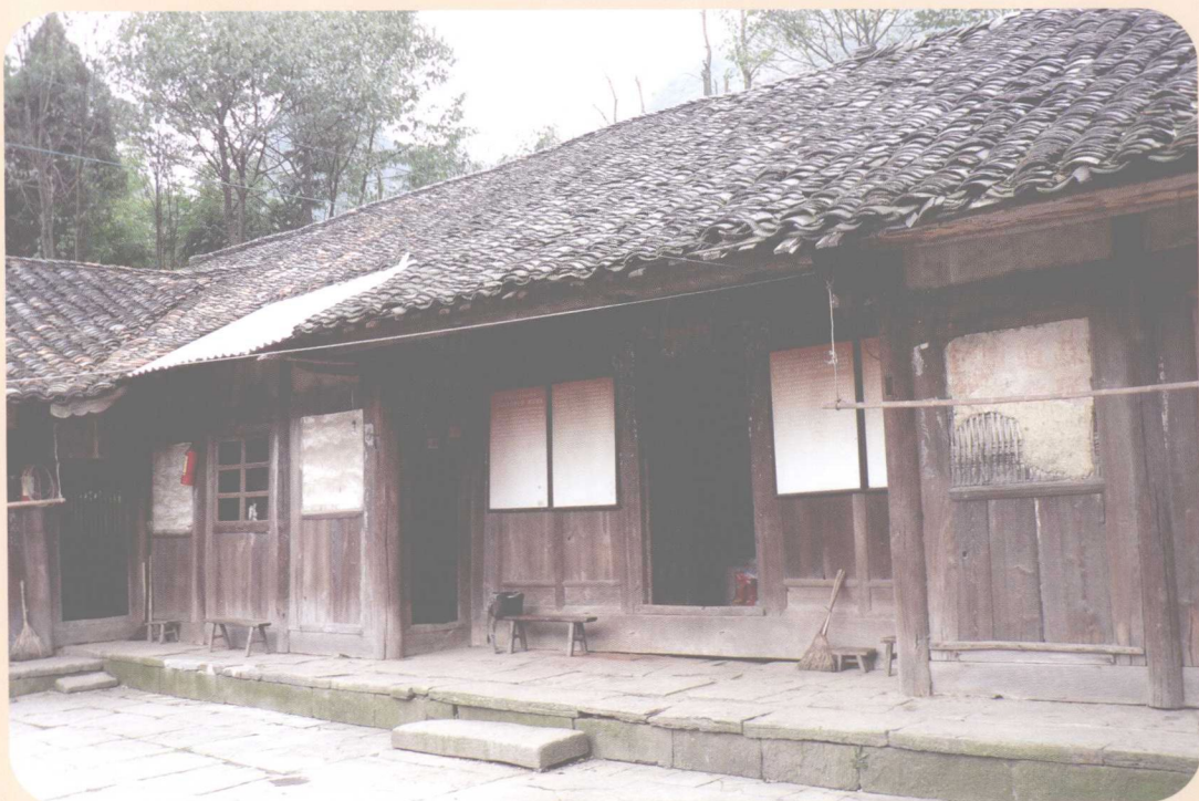
苟坝会议会址(今遵义县枫香镇苟坝村)