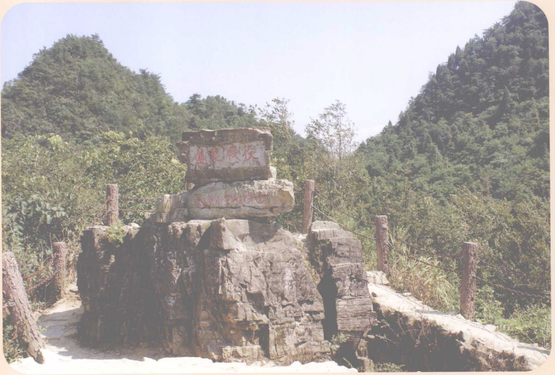
娄山关小尖山战斗遗址