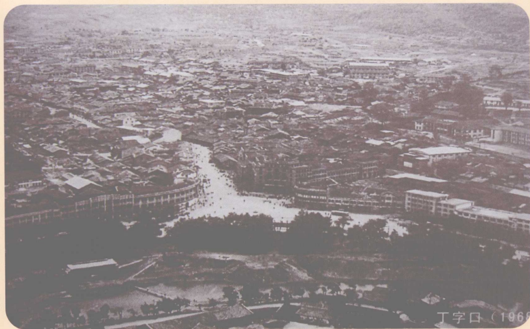
二十世纪六十年代的遵义市丁字口(1968年)