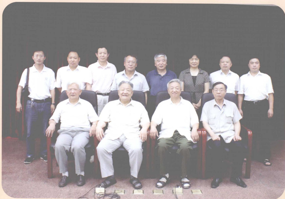
部分专家和课题办公室人员合影(2011年7月)