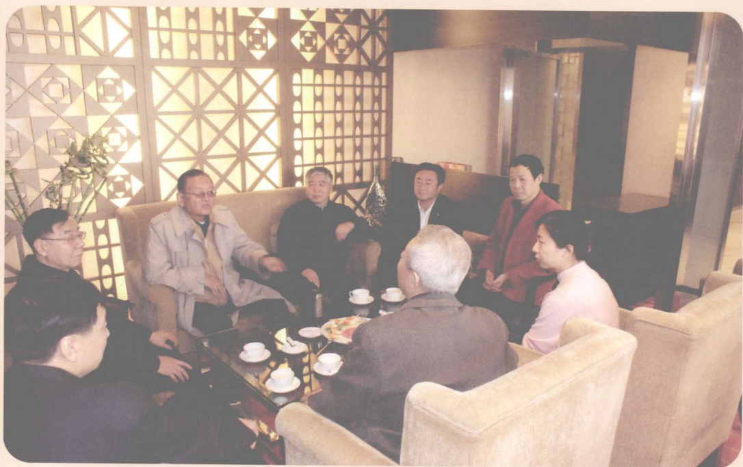
专家组北京会议（2011年10月）