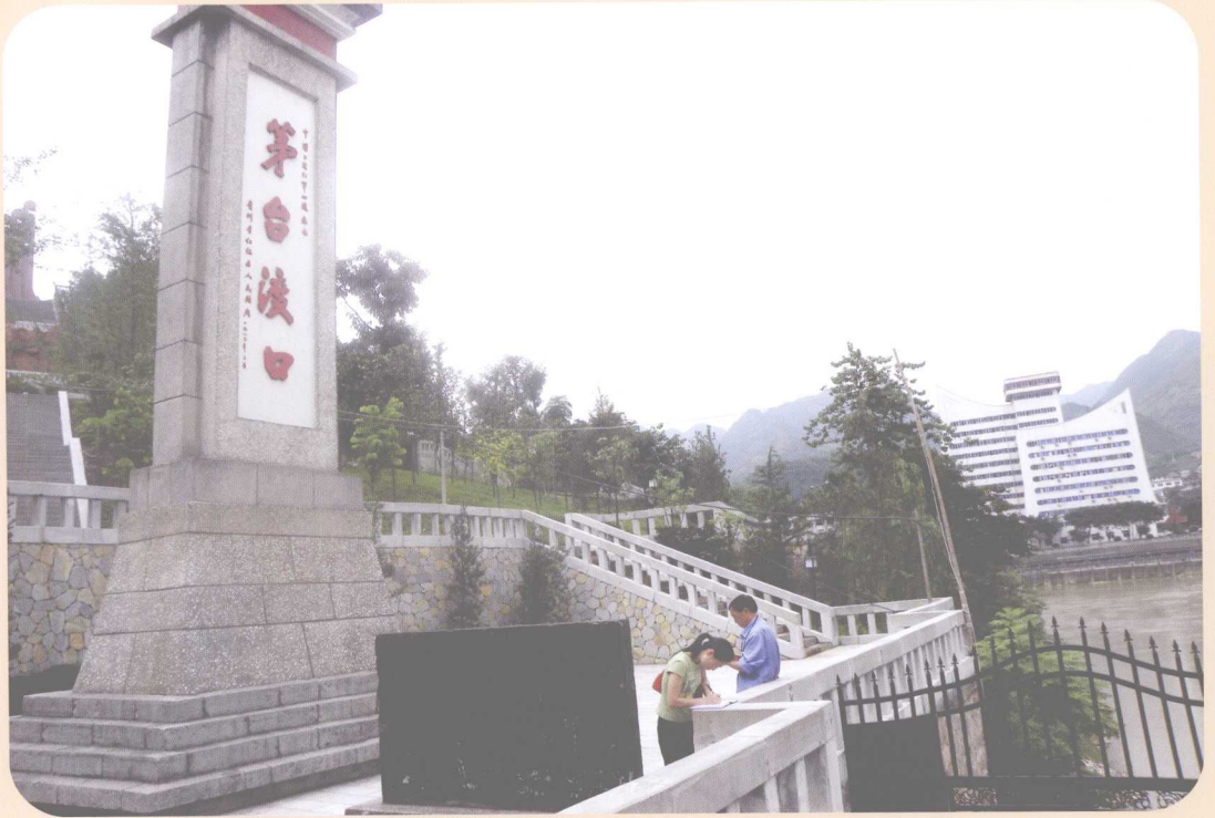
红军茅台镇三渡赤水渡口