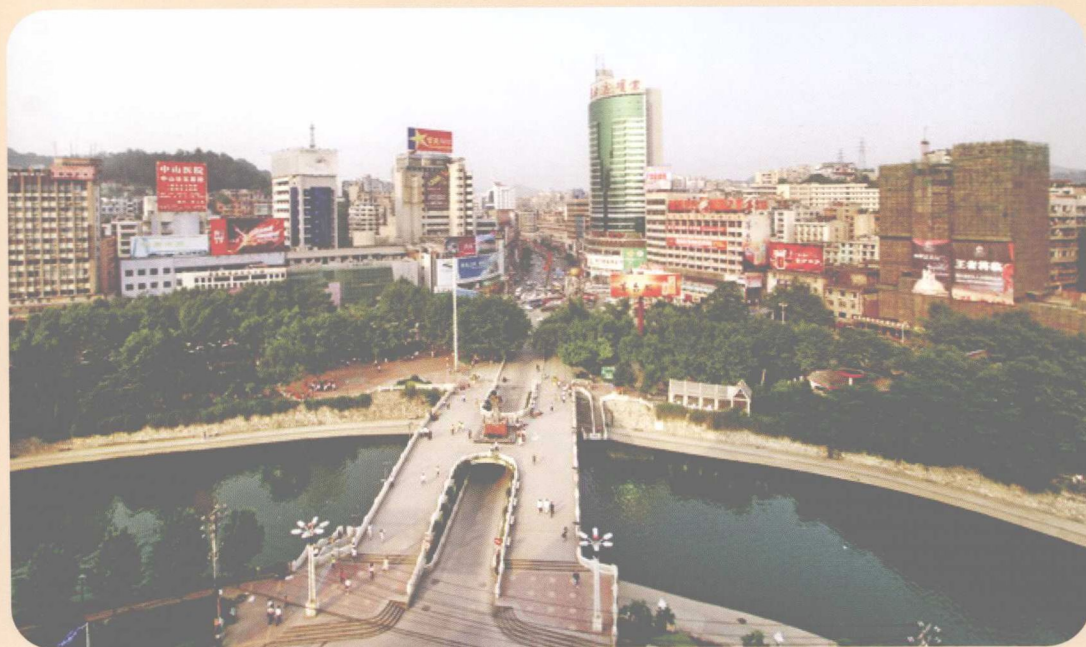
二十一世纪初的遵义市丁字口(2008年)