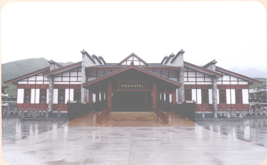
四渡赤水纪念馆(习水县土城镇)