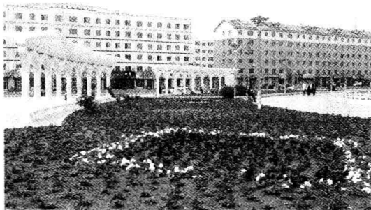
功能齐全的标准化生活小区——九台市

年12月，省委六届六次全会提出了“六大战略”，即改革驱动、开放先导、区域发展、结构优化、科教兴省和“两手抓”。省委七届二次全会提出的“三大战略”是在“六大战略”的基础上提