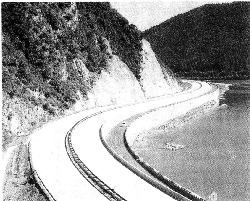
公路建设带动边疆经济发展(长春至珲春高速公路图们段)

续发展,切实保护农业生态,追求农业的长期效益。有关部门要积极协调,抓紧建立农业现代化示范区。要切实搞好农民文化技术培训。各地要在现有教育体系的基础上,完善培训机制,强化培训措施,提高培训效果。各级干部要带头学习,改进工作方法,带领农民学会发展效益农业。