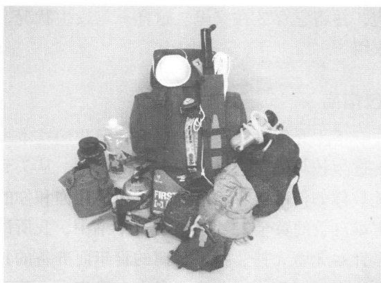
逃生背包，72小时灾难求生装备