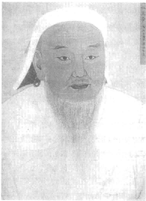
成吉思汗画像（中国国家博物馆藏）

1206年，45岁的成吉思汗经过近20年的浴血奋战，终于统一了塞北高原上的游牧各部落，建立起庞大的草原帝国。它的蒙语国号叫“也客忙豁勒兀鲁思”，意即“大蒙古国”。自从9世纪中叶回鹘汗国瓦解以后，大漠南北的游牧民经历了360多年的曲折和反复，才重新形成一个更为巩固的游牧人共同体。与此同时，“蒙古”作为塞北游牧人共同体的认同名称也逐渐赋有地域指