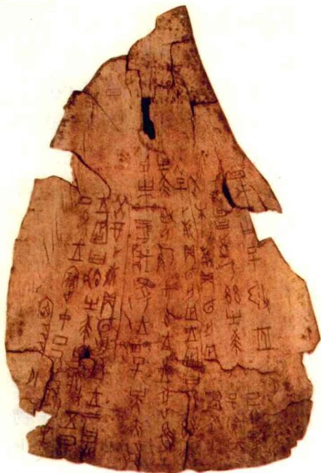
◇甲骨文（商代祭祀狩猎涂朱牛骨刻辞）

商代是青铜器的全盛时代，其品种繁多，主要类别有礼器、兵器、生产工具及车马器，其中最重要的是礼器。另有食器、乐器等。著名的司母戊鼎、妇好偶方彝等都是其中的精品。