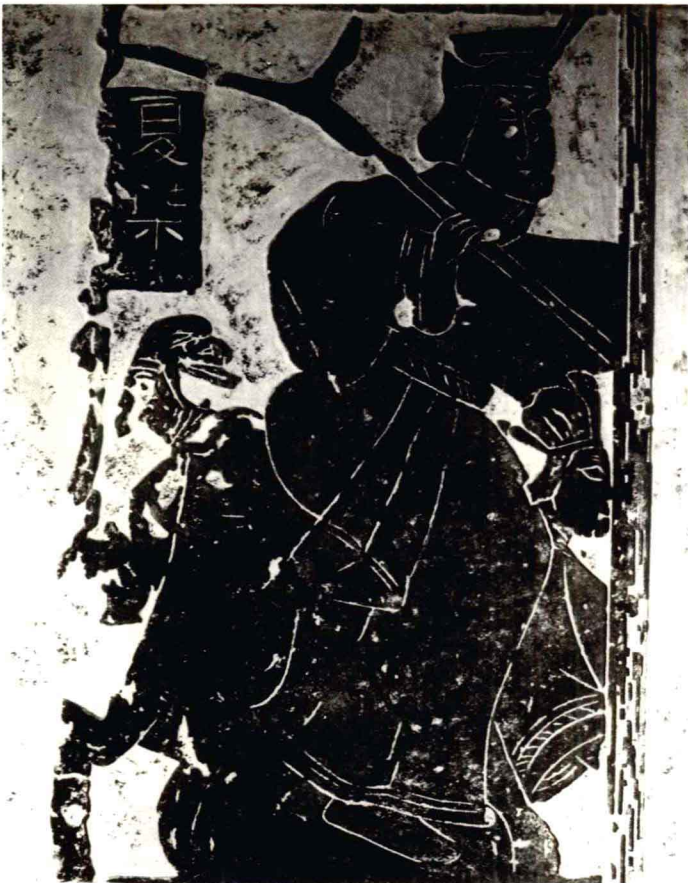
◇夏桀以人为桀雕像

太康失国后不久死去，其弟仲康流落到洛水附近。仲康的孙子少康成年后在有虞（今河南虞城）之君的帮助下，终于伐灭寒浞势力，重建夏后氏的统治，这就是“少康中兴”。至此，夏后氏的统治才得以确立。