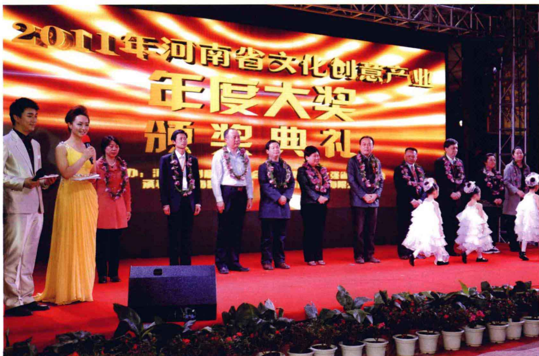
郑州市文产办等荣获产业推动奖