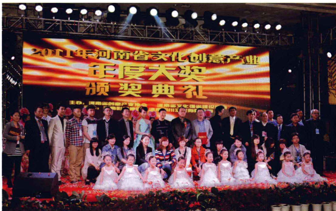
颁奖典礼主办及承办单位工作人员合影