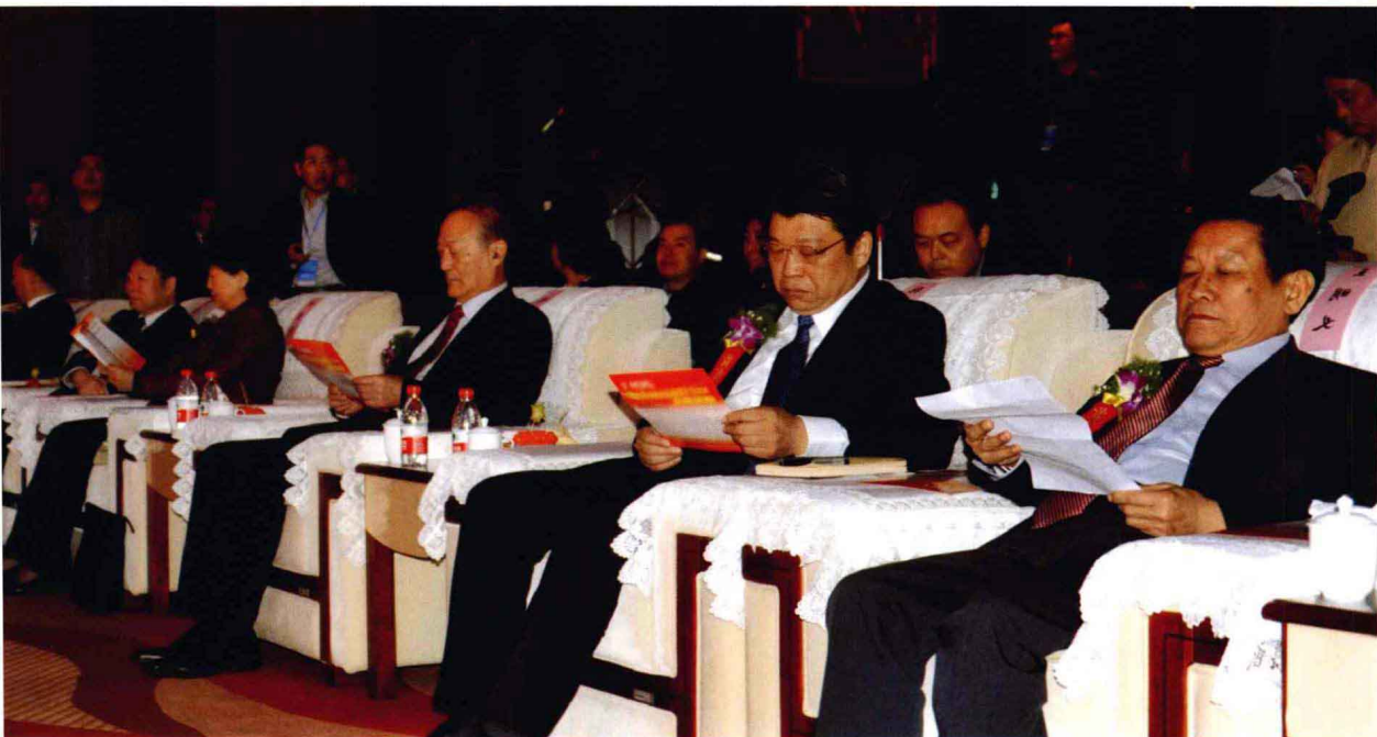
前排右起：王明义、张广智、厉无畏、赵素萍、李英杰、李宏伟

2012年3月28日，由河南省文化创意产业协会、河南省文化强省建设协会联合主办的2011河南省文化创意产业年度大奖颁奖典礼在郑州新郑国际机场凯芙建国饭店举行。全国政协副主席、著名经济学家厉无畏，中共河南省委常委、宣传部长赵素萍，全国人大农业与农村委员会委员王明义，副省长张广智，省政协副主席李英杰，省委宣传部副部长李宏伟，省政协副秘书长胡经文，省广