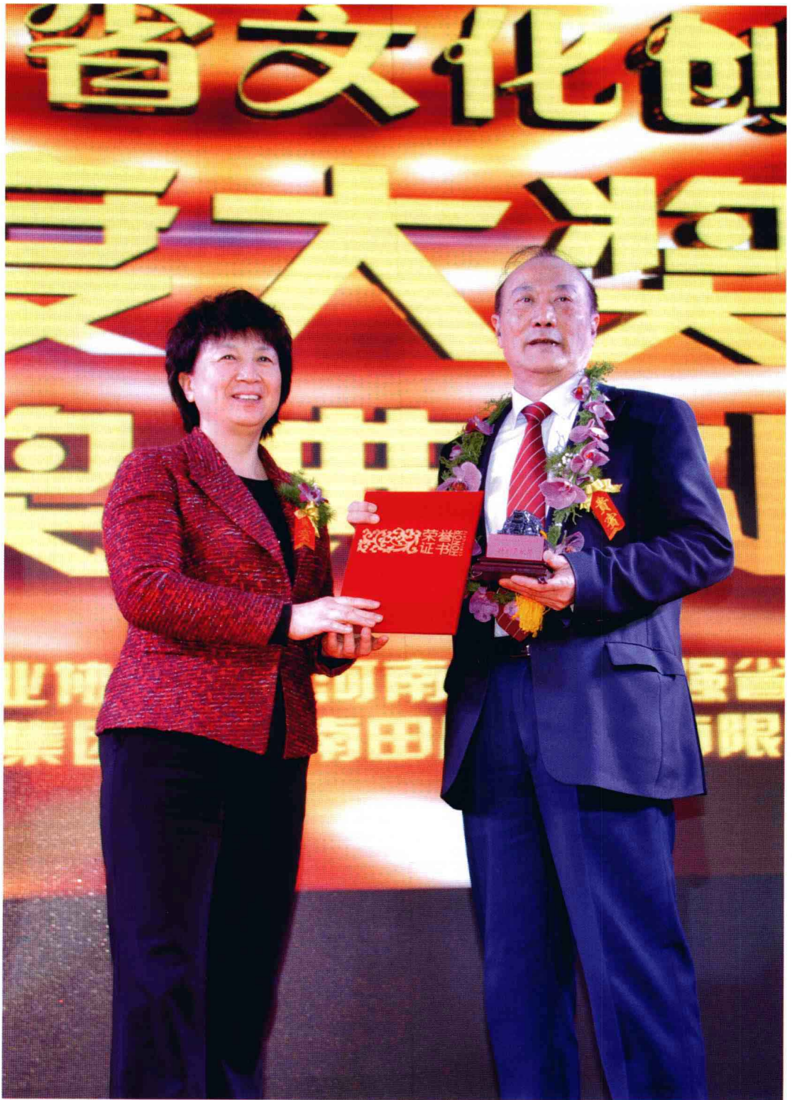
赵素萍部长祝贺厉无畏副主席荣获特别贡献奖