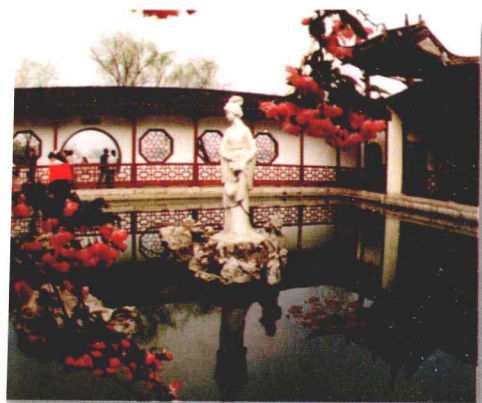
莫愁女的美丽,使莫愁湖含情脉脉。