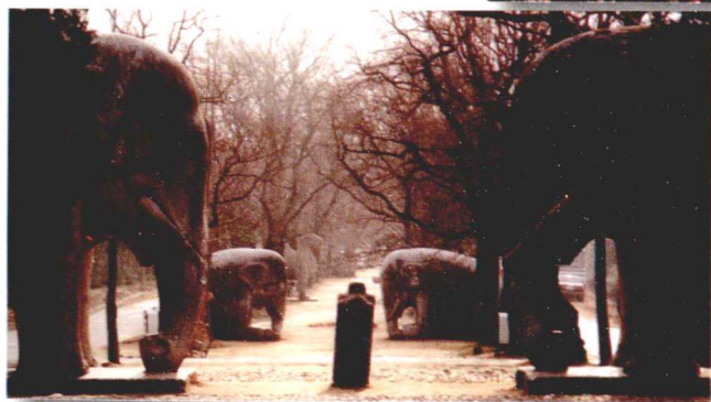
明孝陵一角已见深沉。