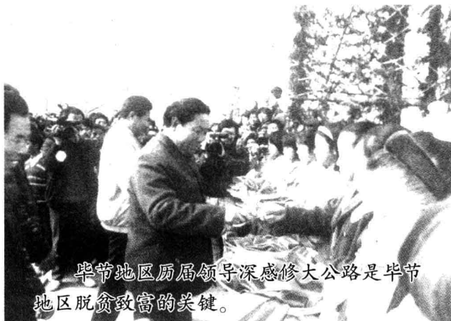
毕节地区历届领导深感修大公路是毕节地区脱贫致富的关键。