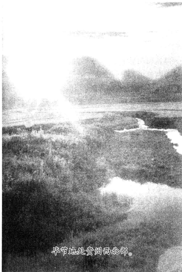
毕节地处贵州西北部。