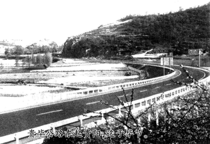
贵毕公路东起贵阳，迄于毕节。