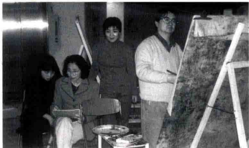
■ 1998年在珠海作人体写生