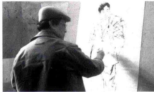
■ 2004年在首师大作课堂写生

在写生教学上，我的观点可能比较保守，我认为写生是基本功，是一种基本训练，不要把写生套上很多外加的光环，不要在学生阶段就强调在写生中进行艺术加工。当然，就广义上讲，任何写生都是有艺术加工的，不可能没有（加工）的绘画。在写生中强调艺术个性。我始终认为艺术个性的形成、艺术家毕生的艺术实践是一个马拉松的过程，一个艺术家毕生的精力从事艺术，这条路是很长的。学生在学校区区四年，跟一个艺术家整个的艺术人生来比是很短暂的。这个阶段就是打基础的，如果过早地强调个性，对学生会形成误导。艺术个性是一个艺术家独特的人生经历、个人的品格、长期的艺术探索和实践，以及各方面长期修养的结果，不是猛然一种灵感出来，靠才气抹几笔，就出来个人风格了。所以，怎么看待在美术院校学习阶段的训练，应该从宏观上来考虑，应该从艺术发展、艺术实践的整个过程来考虑，艺术是终极目标，并不是说每一个时间段都在创造艺术。即使是天才的艺术家也有一个艺术准备的阶段，一些基础的东西必须要解决的。学生在学校就是打基础的阶段，是夯实以后的根基，就像盖房子，学校这几年就是打地基，在这个阶段把地基打好了，将来盖什么样的房子是他自己的事。所以我的观点是，学院里的写生教学要作为基本训练的范畴来对待，不要过早地追求艺术个性和艺术创造。当然写生中应该有艺术创造的成分和艺术创造的因素，但是不要无限地扩大这个因素，要把握一个度，不要急于求成，不要以为一进美院自己就是艺术家了，我觉得这不利于学习。