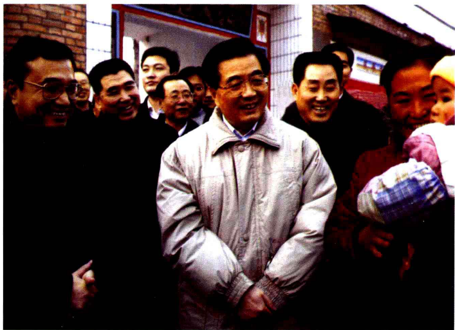
胡锦涛总书记在西刘村与当地农民亲切交谈， 了解生产生活情况