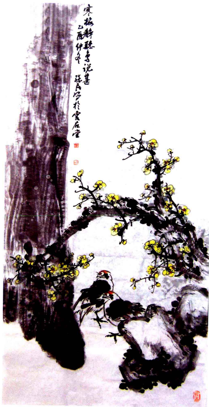
作者：商丘市政协委员、政协书画院副院长孙民