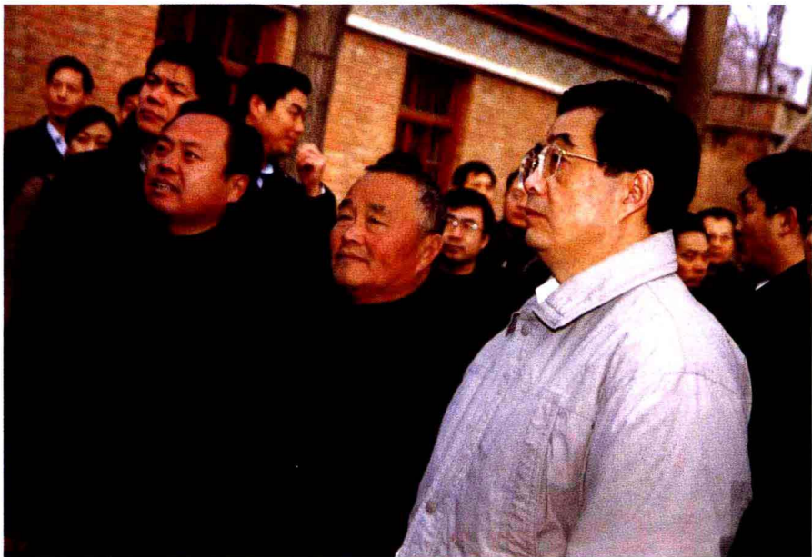
胡锦涛总书记和基层党委书记、支部书记在一起