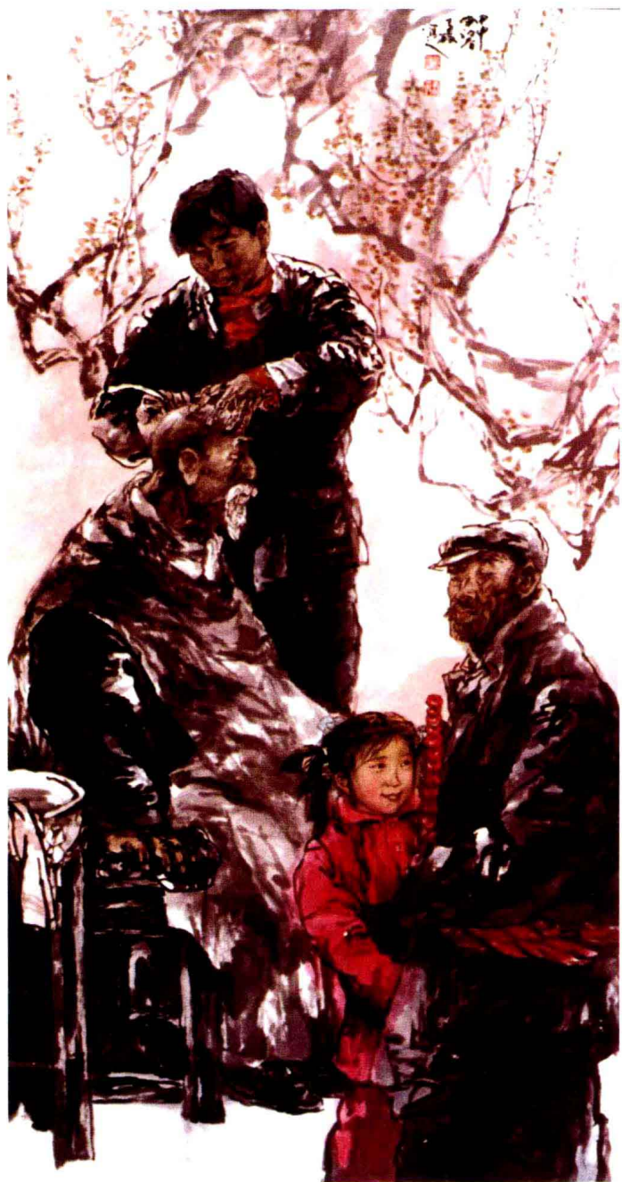
作者：市政协委员、中国美协会会员、 市美协主席王清健