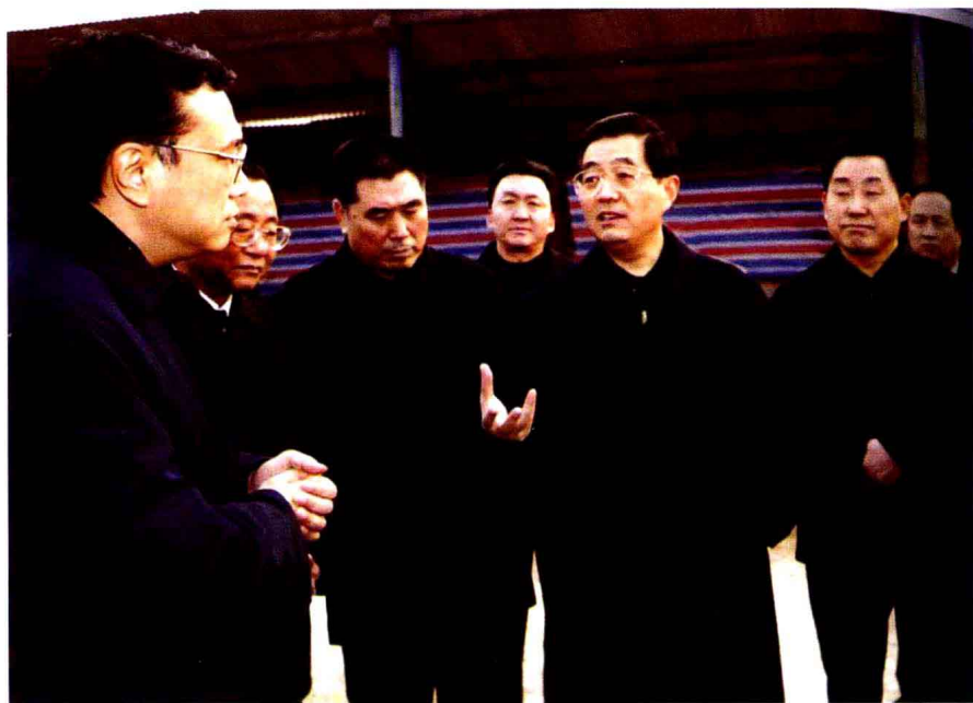
胡锦涛总书记在科迪集团与省、市领导亲切交谈