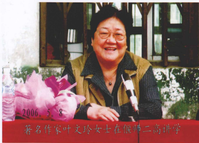
在河南偃师二高讲学