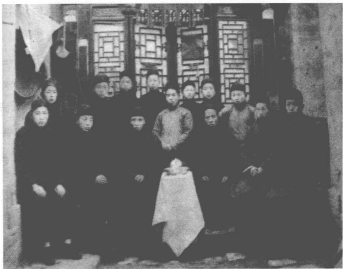
民国时期的陕西商人

进入明末清初，徽商由于买通官府“输银换引”而在扬州势力大增。晋商又因贴近清王朝而受到偏爱，势力压倒了陕商。陕商以汉族正统自居，壮怀激烈，大量从扬州撤资，实行战略转移，“弃准入蜀”，在四川的大地上又刮起了商品经济的“西北风”，搅得四川自然经济秩序乱了套。陕商最初在四川办钱庄、办典当、办商号积累资本，“川省正经字号均属陕商”，到乾嘉年间利用“招商认引”的政策机遇，又一次进军井盐贩运，使川盐贩运大部分掌控在陕商手中。然后以借地入股的方式进入井盐生产，使“川省井盐投资秦人占十之七八”，成就了四川井盐的历史辉煌。四川自贡的井盐是陕商一手搞起来的。自流井的磨子井、耳勺井、源发等高气田盐井都是陕西人开的，陕西商人创造的用竹筒输盐