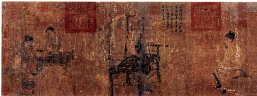
唐 佚名 萧翼赚兰亭图