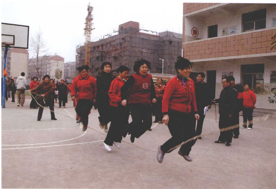
邻里节趣味运动会。