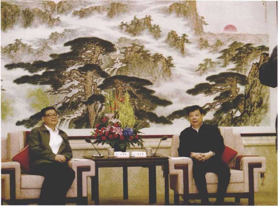
2011年9月18日，中共山东省委书记姜异康就中国社会科学院专家对历城阳光民生救助体系建设进行调研，会见中国社会科学院党组副书记、常务副院长王伟光等一行11位专家成员。图左为王伟光。