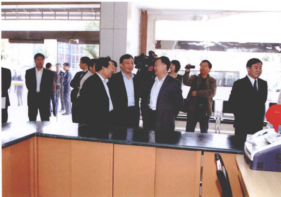
调研组成员参观济南市历城区阳光民生救助服务大厅。图右一为历城区常务副区长杨玉军，右二为李群，右三为李传章，右四为山东社会科学院院长张华，右五为山东省委党校副校长李永清。