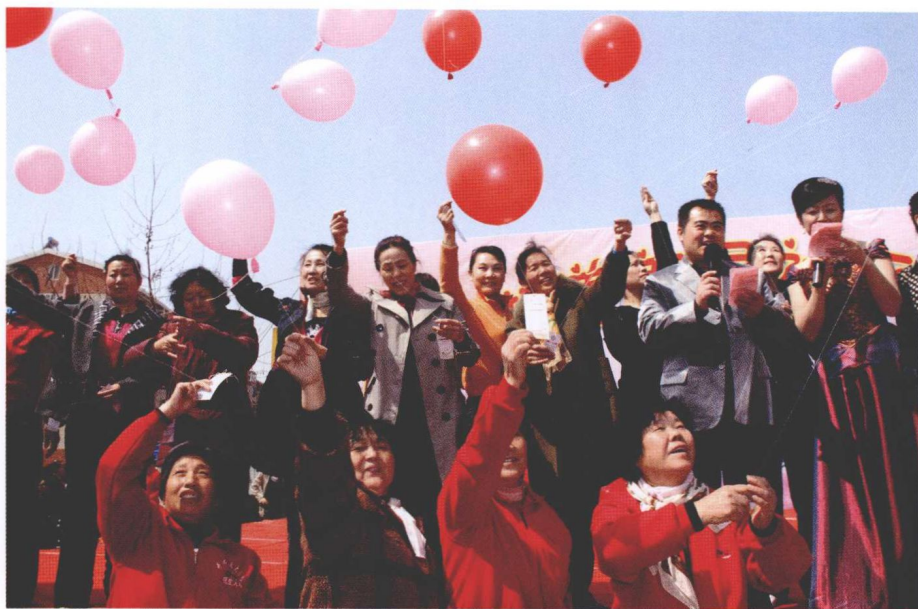
首届邻里节居民放飞气球圆梦。