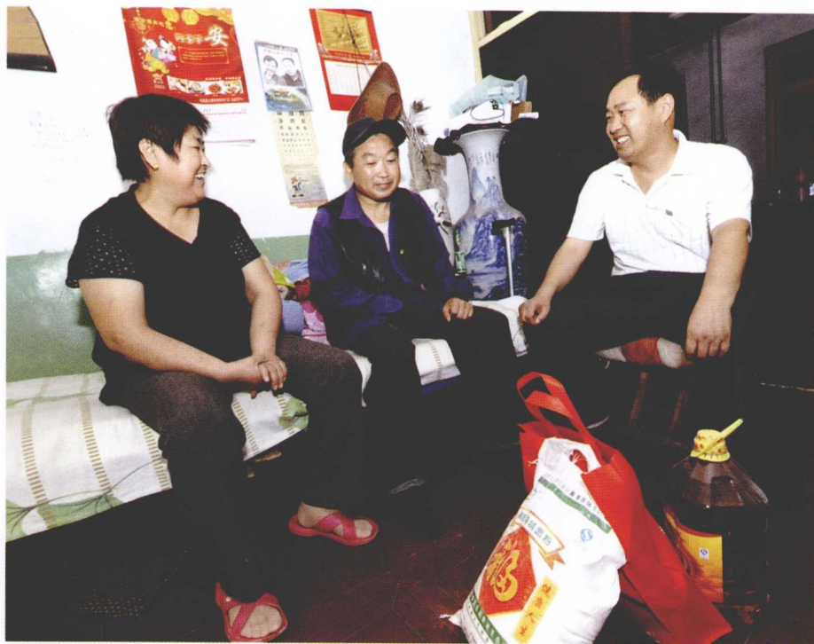
邻里互助居民心更近。