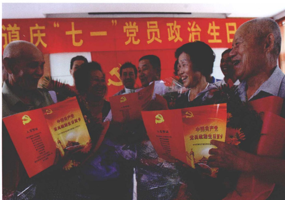
街道党员政治生日会让党员们时刻铭记自己的责任。