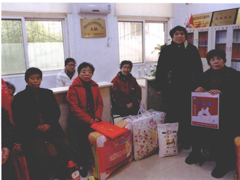
社区居民踊跃为邻里互助站捐东西。