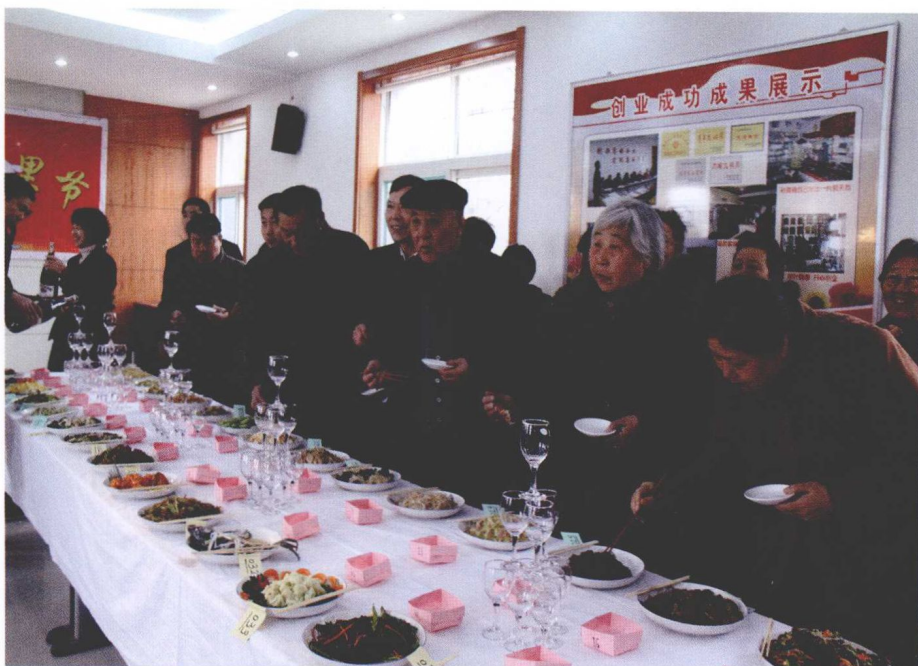
邻里节期间，全福街道桑园北社区的百家宴齐乐融融。