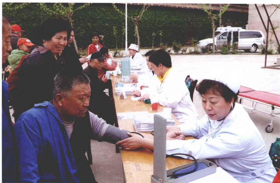
社区免费组织辖区老人查体。