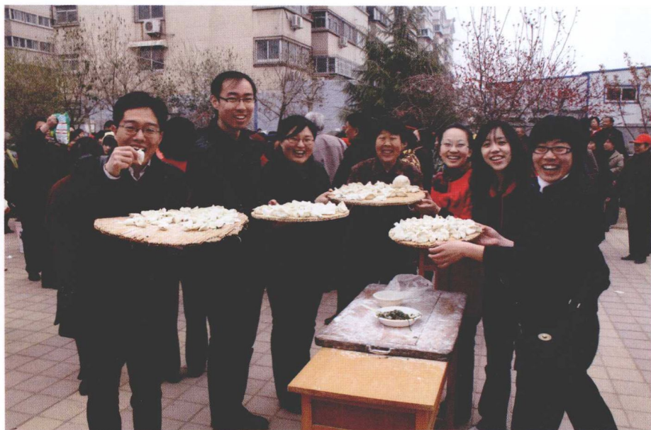
邻里节社区饺子宴其乐融融。