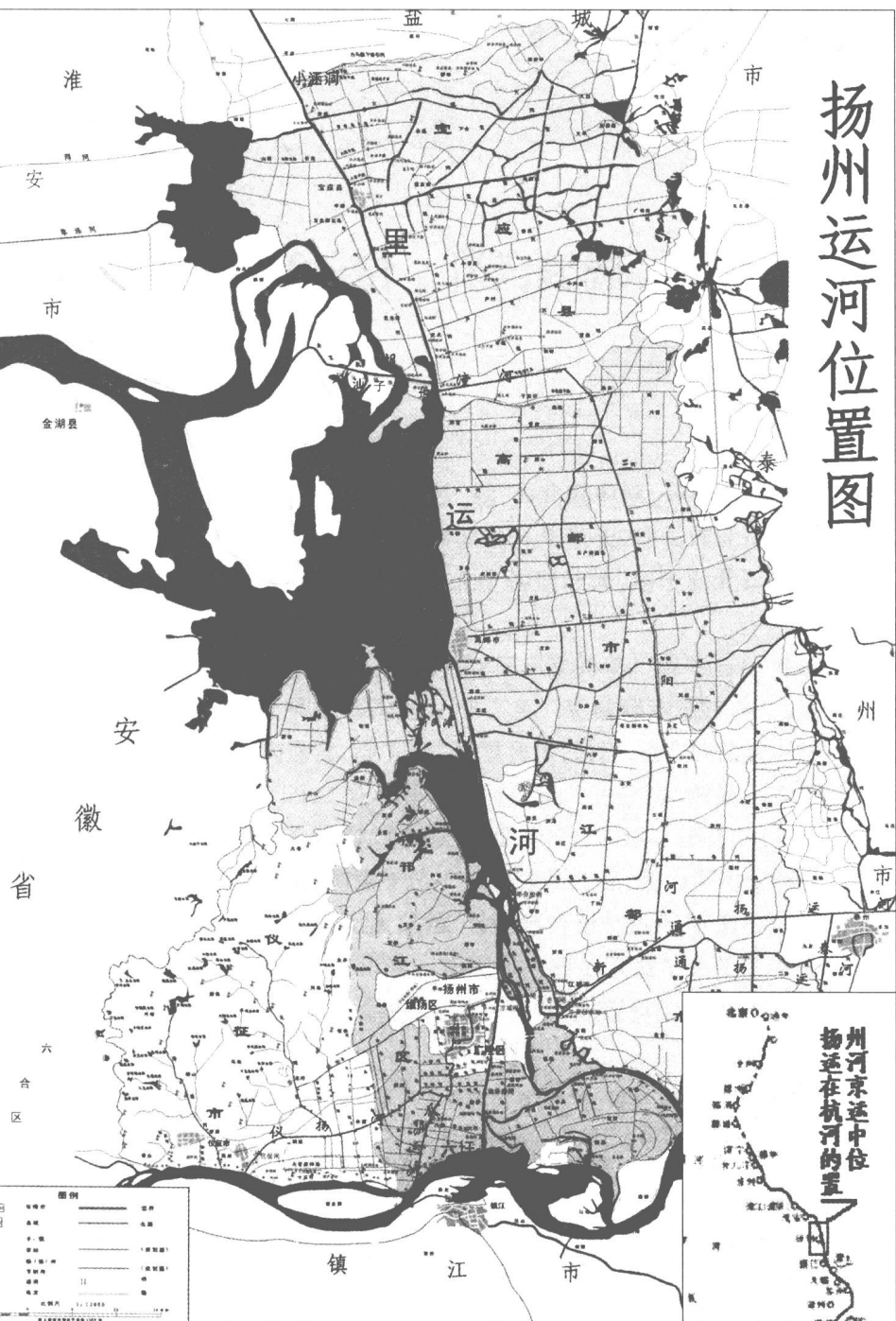
据《扬州市水系图》编制