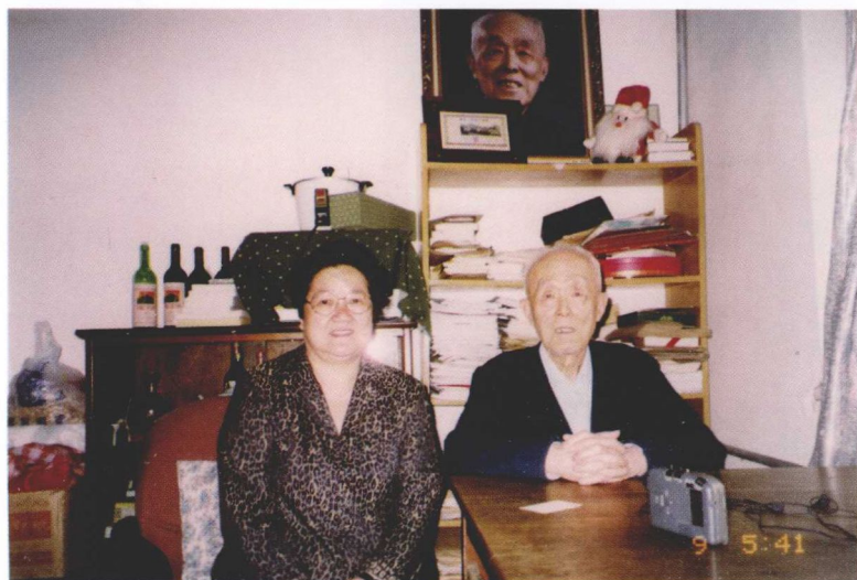
到北大看望季羨林