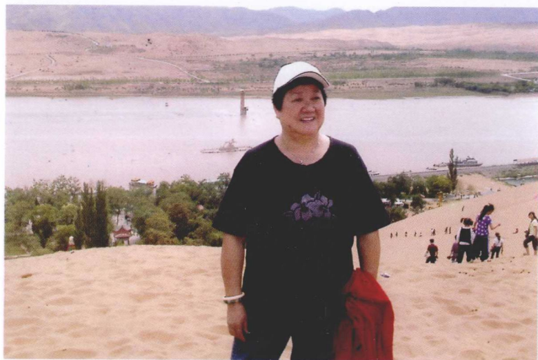
沙漠前面是条大河