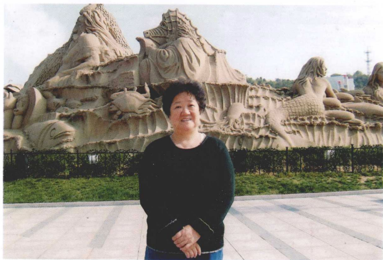
朱家尖海滩的沙雕