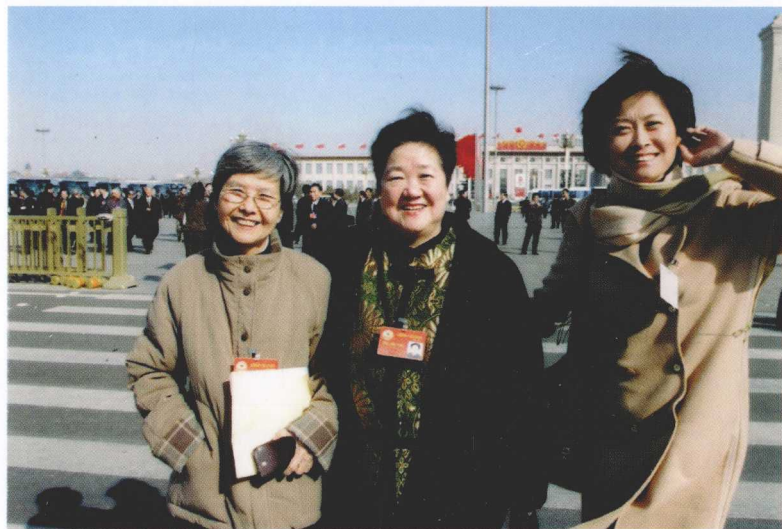
▣▣ 与樊锦诗、敬一丹在人民大会堂前