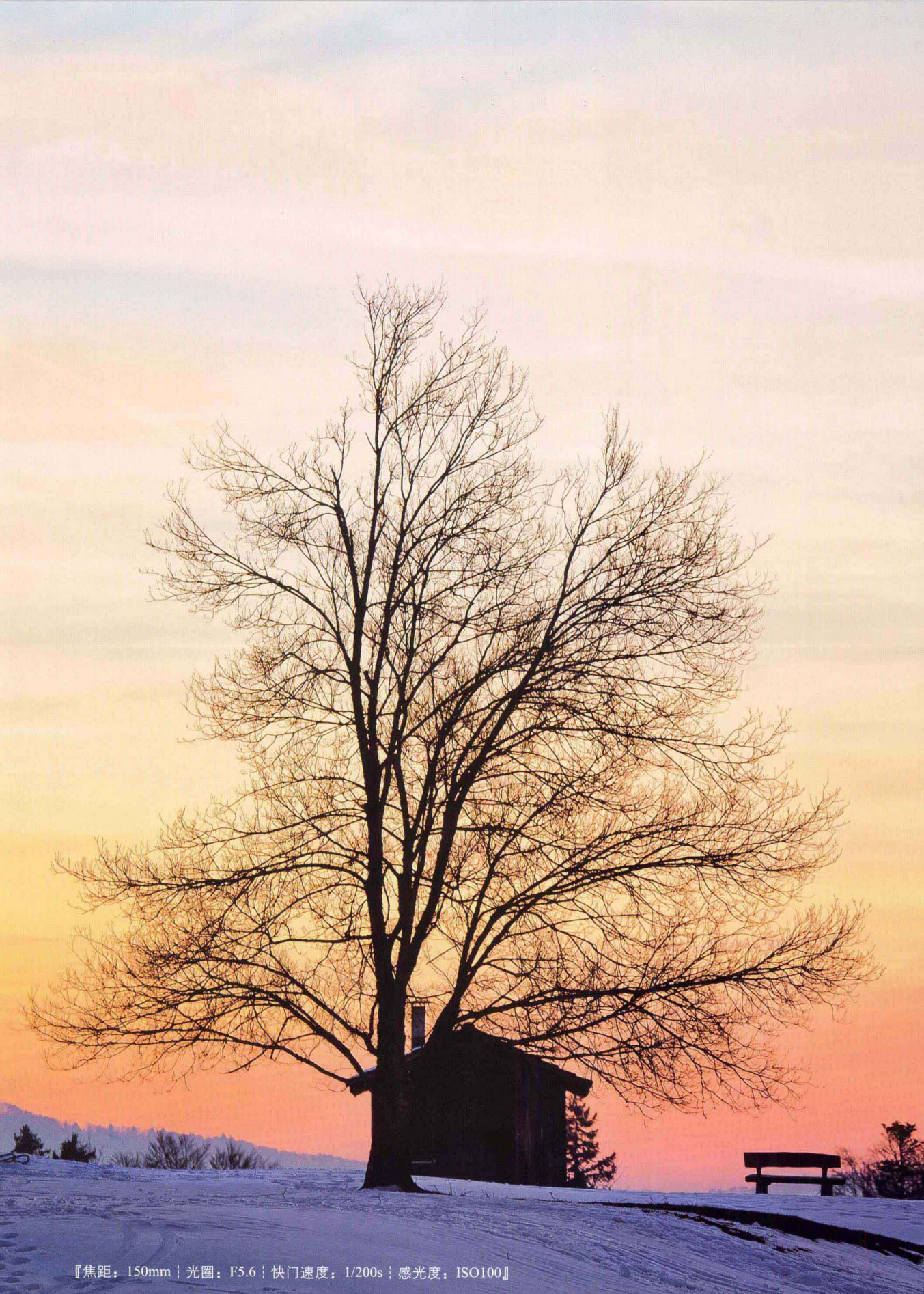
【焦距：150mm | 光圈：F5.6 | 快门速度：1/200s | 感光度：ISO100】