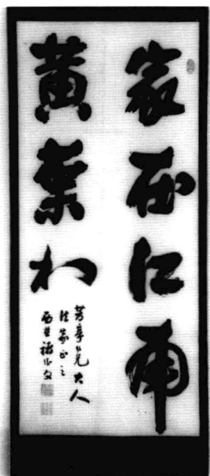
晚清书法家胡纯厚书法作品(左图)、褚继文书法作品(右图)