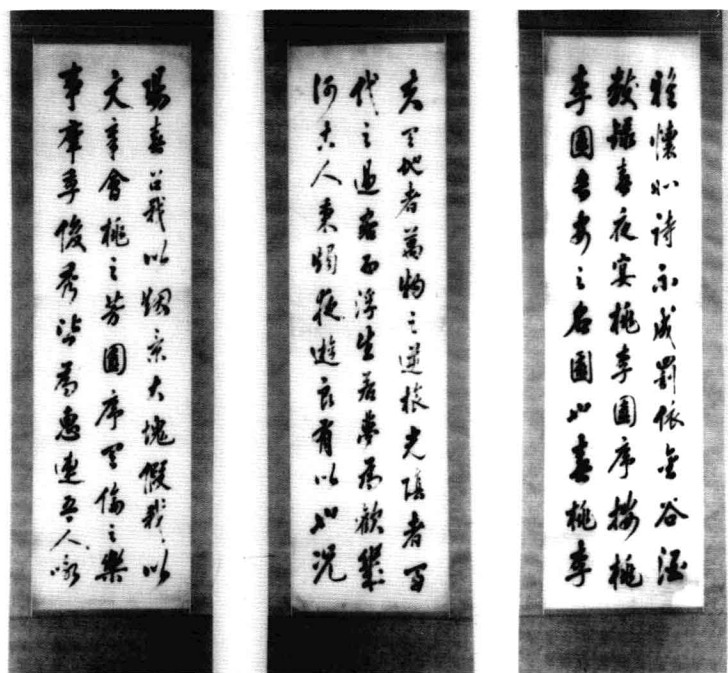
晚清书法家刘宏辰书法作品