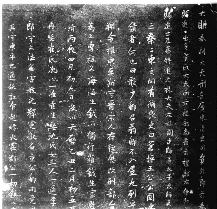
明、张瑞图 王苍坪墓志(局部)