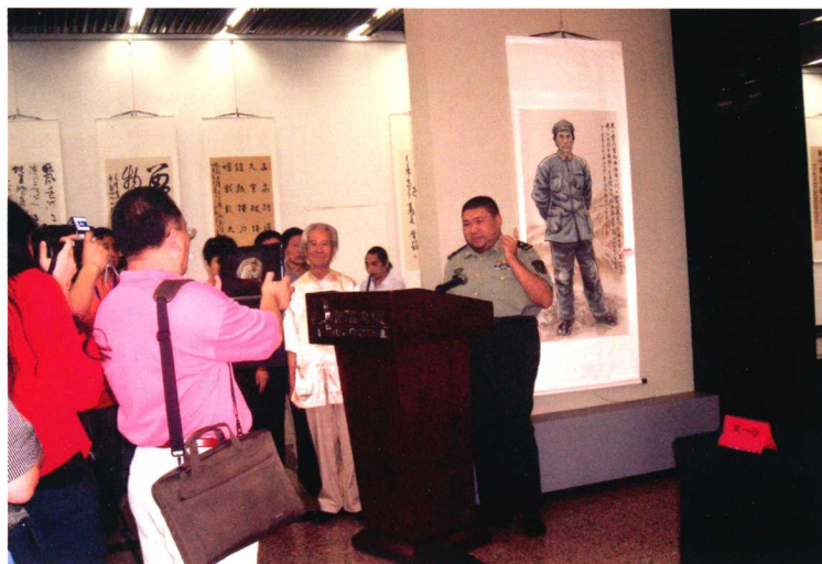
2012年7月28日，中国扇子艺术学会举办书画展，毛新宇在会上讲话。