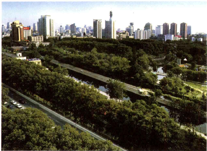
满眼绿色的绿城郑州

热,烈日当头,无遮无掩,行人饱尝曝晒之苦。解放后,郑州市的园林绿化建设在历届市委、市政府的正确领导下,坚持科学的发展方向,从77株行道树起步发力,获得了“绿城”美誉;从绿化低谷跳跃冲高,摘取了“国家园林城市”的桂冠;从百尺竿头更进一步,实施了“绿城”变“花城”工程,进入了生态绿量与景观质量协调发展的快车道。