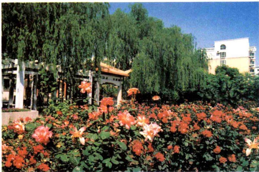
鲜花盛开的月季公园