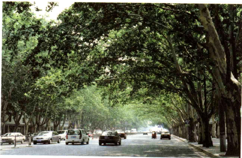
绿荫遮天的人民路法桐树

1961年以后,郑州市对街道绿化树种作大幅度调整和充实,增大了耐干旱、少病虫害树种的比重,大量充实常绿树种和花灌木,还与林业和卫生部门合作,多次组织飞机喷药,进行杨树社蛾和大袋蛾等害虫的防治。1963—1965年,道路绿化水平逐步升级,完成嵩山路、中原路、伊河路等新建道路的绿