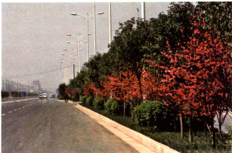
四季有花的三环路

观叶植物数万株,形成了“四纵六横”的观花大道。“四季常绿、三季有花”的目标基本实现。每逢重大活动或重要节日期间,全市还在重要路段摆放鲜花数百万盆。