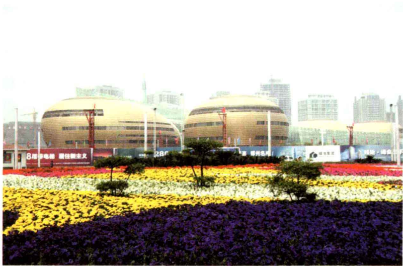
花园锦簇中的河南省艺术中心

解放前,郑州“无风三尺土,下雨满街泥”,是一个名副其实的“风沙城”。5.2 平方公里的市区内没有一个公园和苗圃,仅有 77 株行道树,庭院树木寥寥无几。冬春季节,干旱多风,风起沙飞,尘土弥漫,行人备受风沙之害;夏秋季节,高温炎