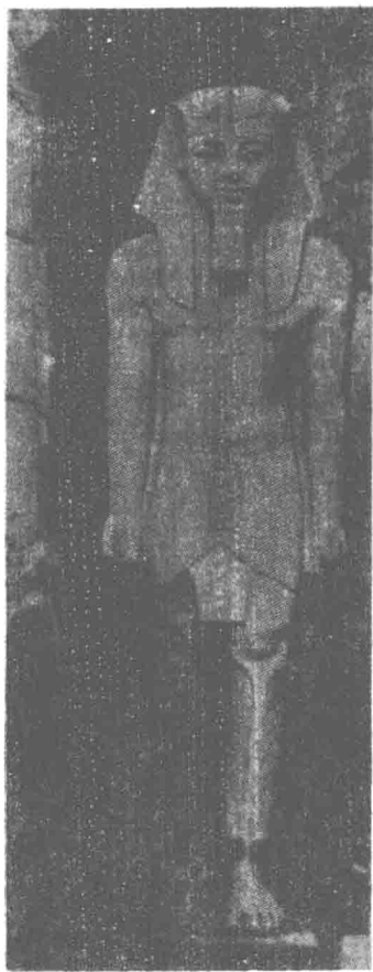
第一圖 拉美斯二世

在 阿比多斯 建立一個石碑。這些石碑如今在各博物院中，可以找到不少。但平民們卻止能有送一片陶器至聖地之力，所以經過許多時代， 阿比多斯 竟成荒蕪不堪的瓦礫堆，各期各種的陶器都有。在埃及史上， 阿比多斯 雖不重要，在宗教和文化上， 阿比多斯 卻公認為一個重要的古址。所以許多埃及學者，早就計算到發掘這個聖地，以期對於古埃及的宗教與文化有豐富的收穫。