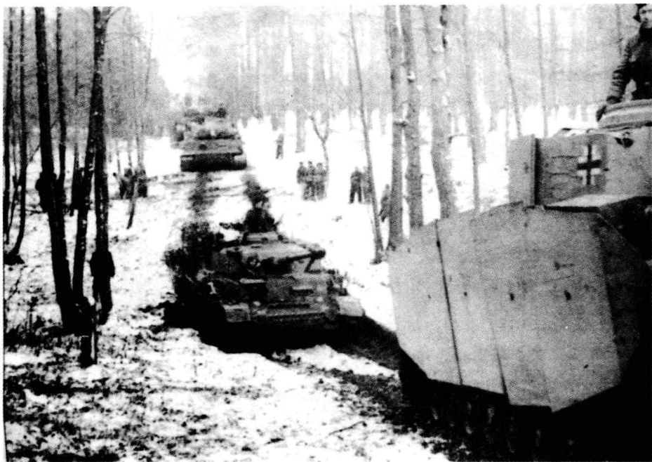
▲德国的IV型坦克和“虎”式坦克在苏联的树林中前进