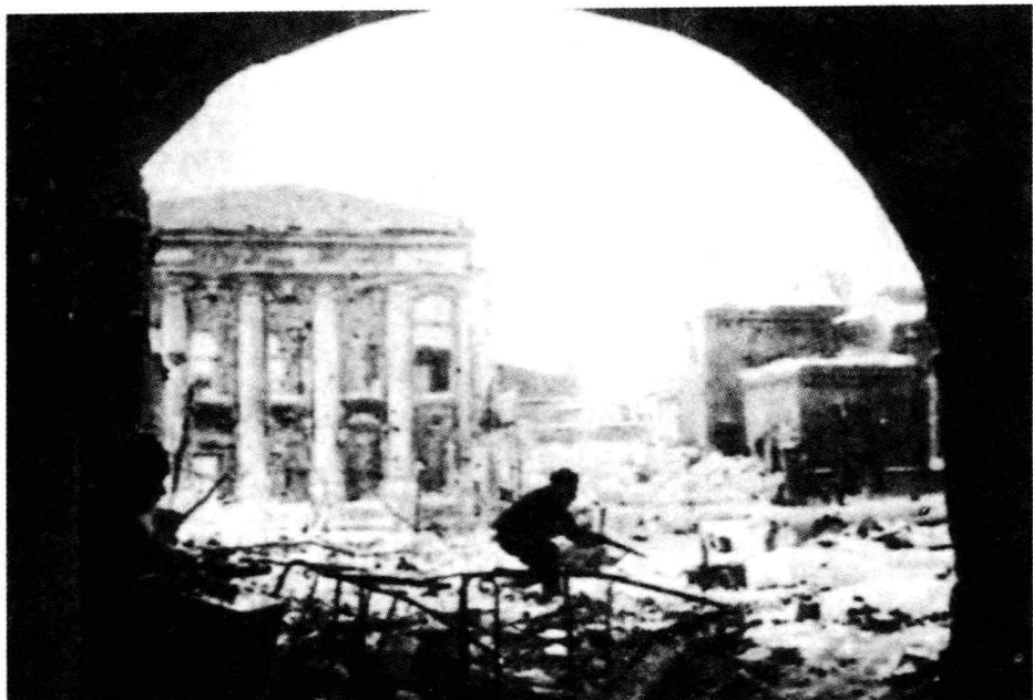
▲德军步兵在断壁残垣、积雪覆盖的道路上行进