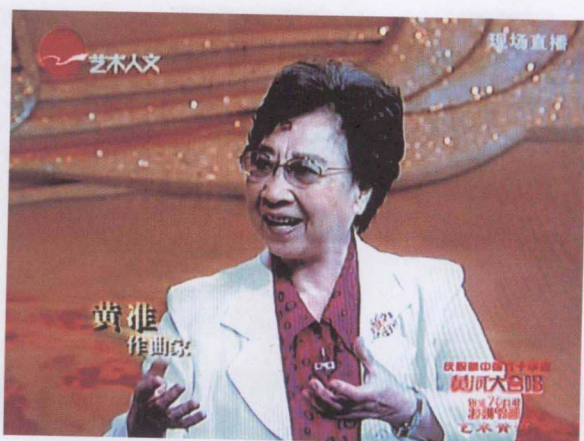
2009 年在纪念“黄河大合唱”诞生 70 周年时接受电视台采访