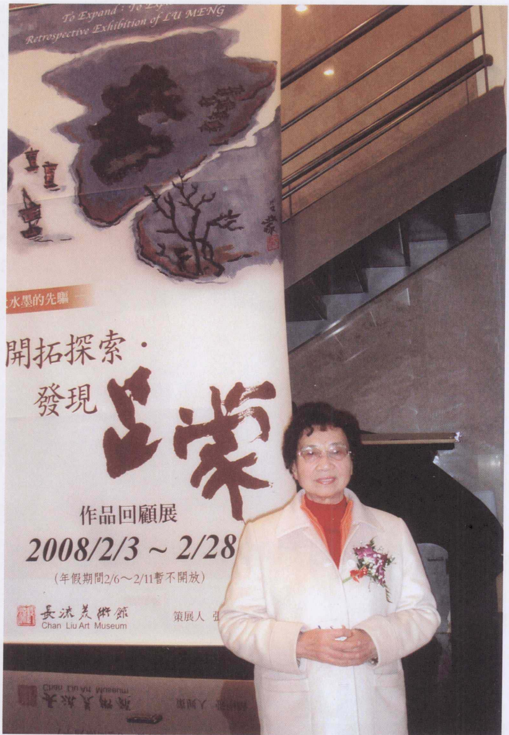
2008年在台灣“呂蒙畫展”上