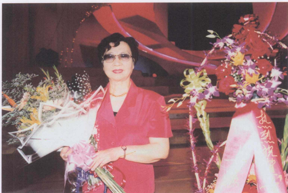
1998 年黄准作品音乐会