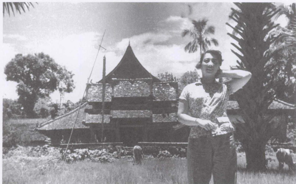
1958年在云南橄榄坝寺庙大门前