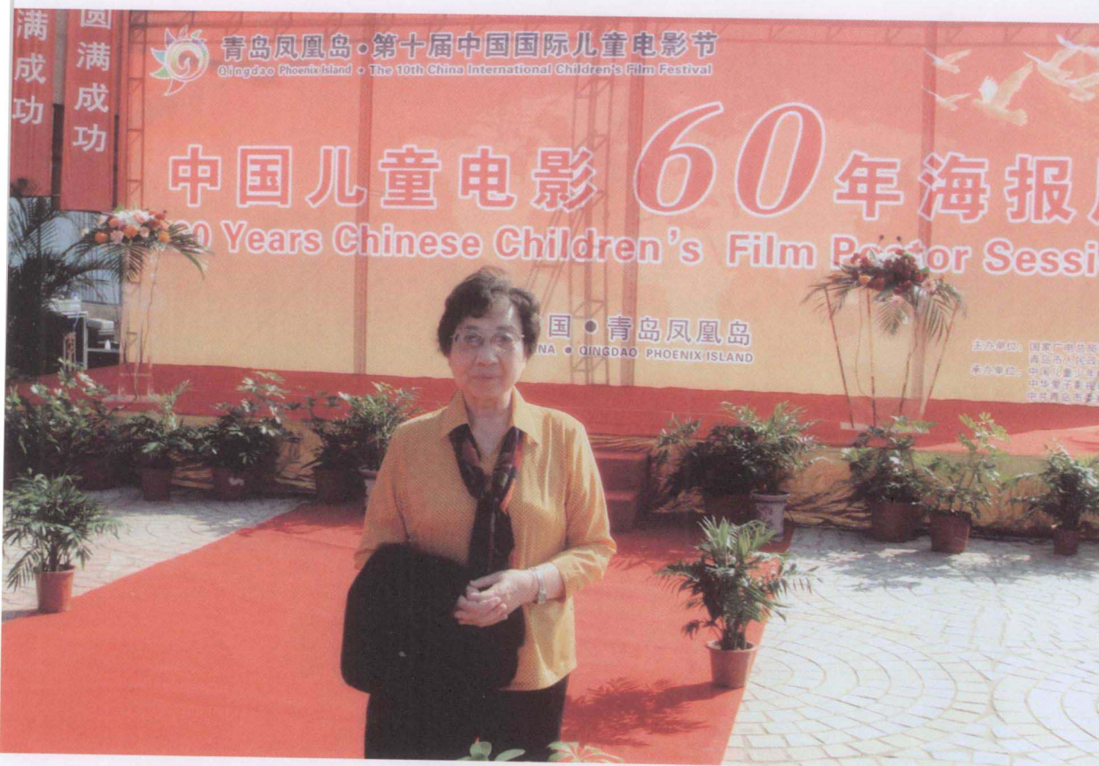
2009 年在青岛国际儿童电影节上