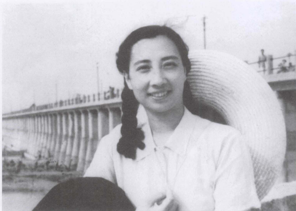
1953年为拍《淮上人家》在淮河佛子岭大坝外景地