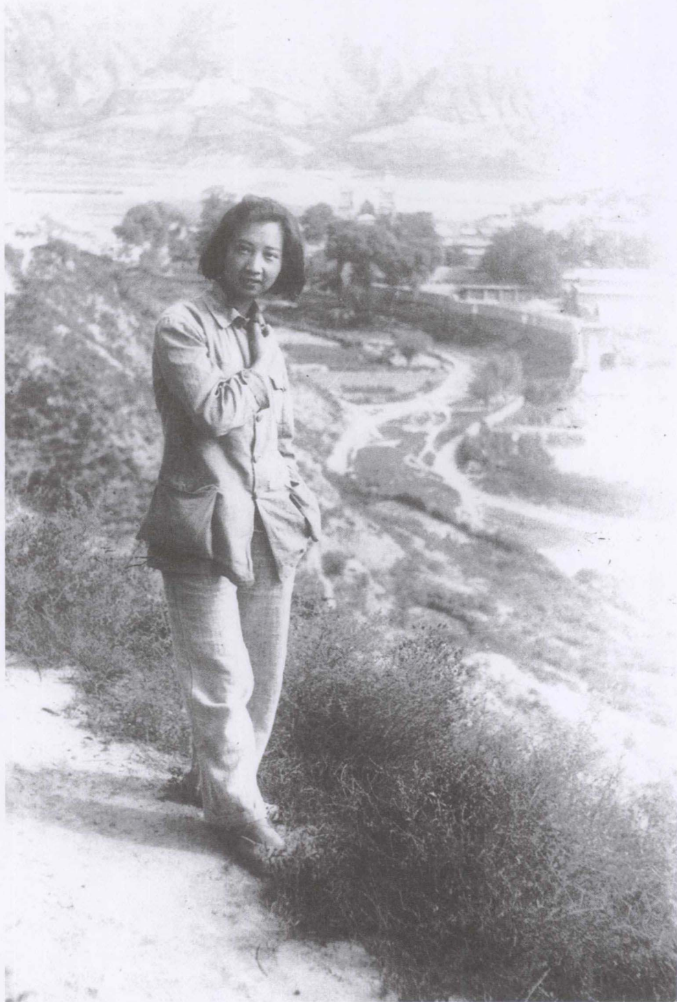
1940年在延安桥儿沟鲁艺的后山坡