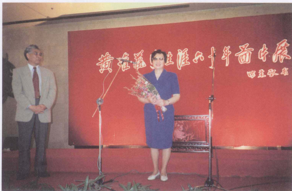
1998 年黄准作品研讨会