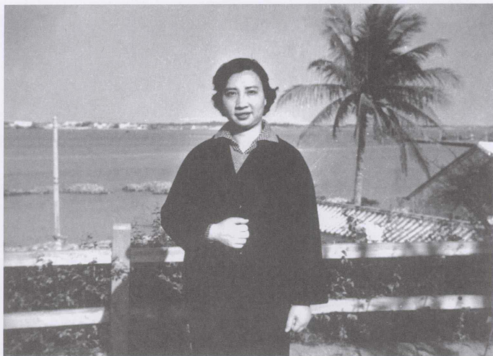
1959年在海南岛《红色娘子军》外景地