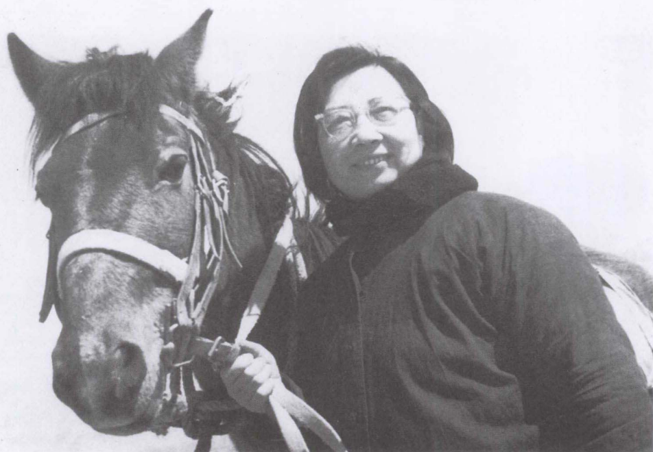
1976年在甘肃藏族地区