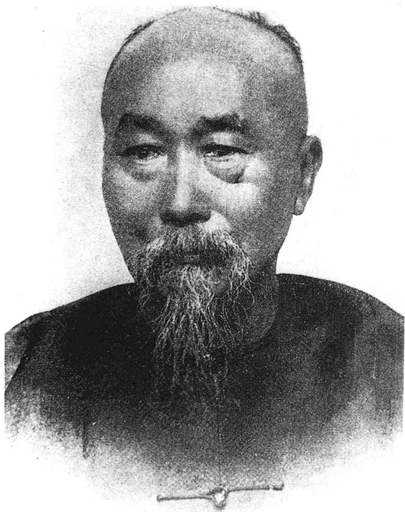
李鸿章像，一八九六年摄影，左眼下为一八九五年在日本马关被刺留下的枪弹伤痕。