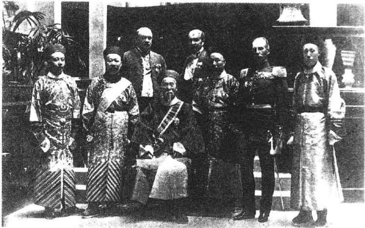
一八九六年李鸿章出使外国时的摄影，图中坐者为李鸿章，左一为李氏之子经述，左二为李氏养子经方。