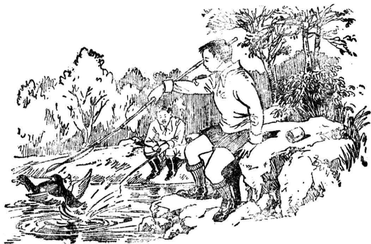
險些打死人家的鴨子

這時，我們已走到鄉下。有四個人從後面走來，比我們走得快，不久就走到我們身旁了。這四個人中間，有二個穿黑色制服，其餘二個身體一高一矮，都穿